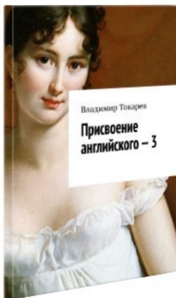
Рис. 1. Одна из книг новой серии «Присвоение английского».

Продолжением этой книги является наш новый проект – «Присвоение английского»