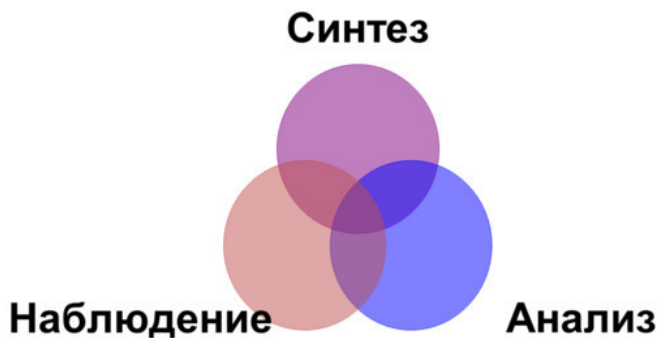
Рисунок 1. Элементы научного метода

Давайте проанализируем рассказанную историю, используя для этого элементы научного метода, представленные на рисунке 1 4 :