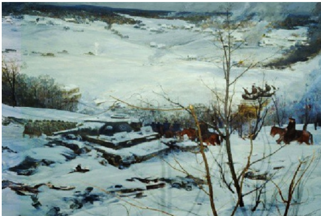
Фрагмент панорамы Перемиловской высоты