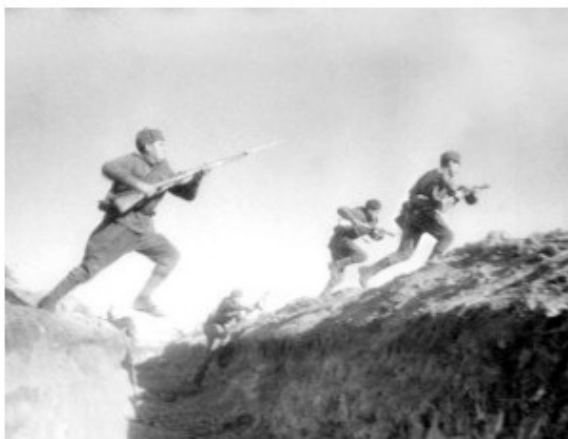
Битва за Москву, декабрь, 1941 г