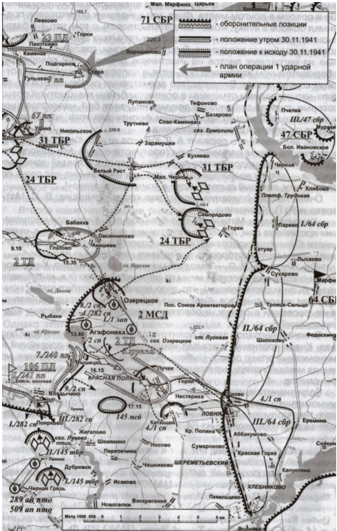
Положение 30 ноября 1941 г. – 64 стрелковая бригада в обороне. Правый фланг от Икши – части 1 Ударной Армии