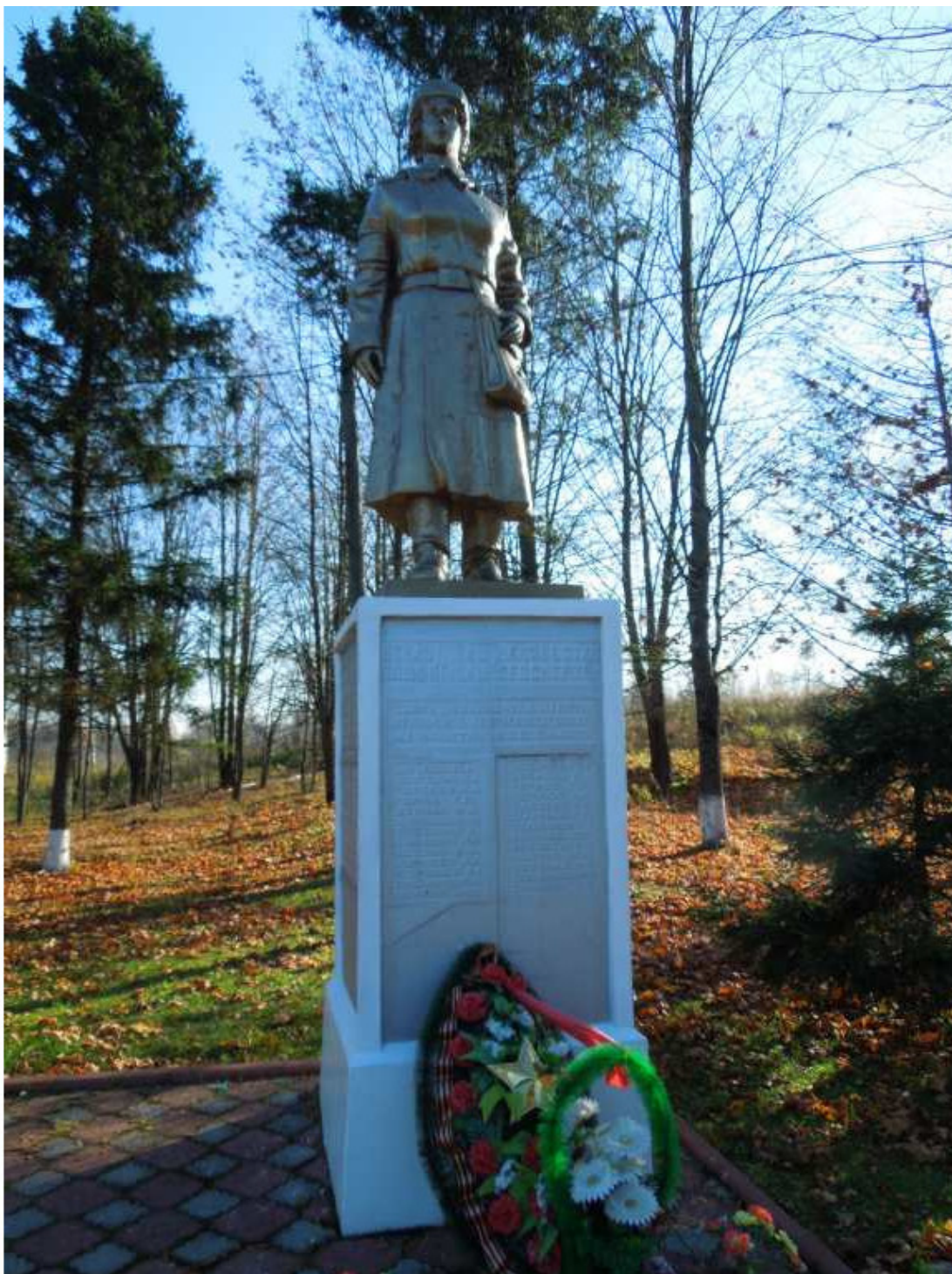
Здесь увековечена память жителей поселка Деденево – жертв бомбежки немецкими фашистами военного госпиталя 5.12.1941.