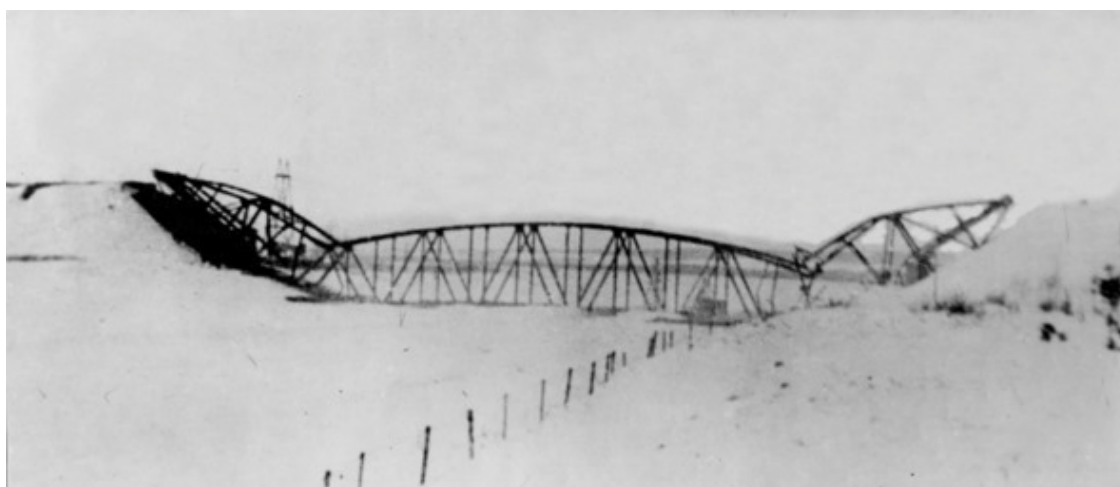
Дмитровский мост после подрыва. Декабрь 1941 года

На канале была устроена подвесная люлька. В ней, до отказа набитой людьми, эвакуировали на восток Подмосковья детей, женщин и раненых. По словам очевидца, люлька была так перегружена и так сильно раскачивалась при перемещении, что, казалось, вот-вот оборвётся и рухнет вместе с живым грузом в ледяной канал.