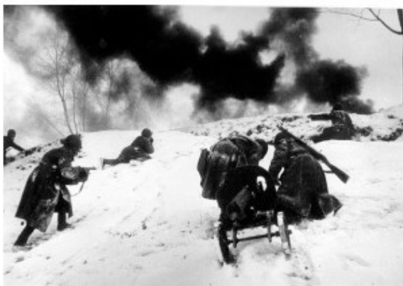
Битва за Москву, декабрь, 1941 г

В середине октября 1941 года военные донесения о боевых действиях в Подмоскovie фиксировали серьёзную распутицу: непролазную грязь и первый снег. В последних числах октября наступление немецко-фашистских захватчиков остановилось у рубежей Москвы. В итоге, к началу ноября в полукольце вокруг Москвы наступило кратковременное затишье, но к середине месяца, когда подморозило, и у транспорта и пехоты появилась возможность перемещаться по местности вне зависимости от наличия дорог, наступление немцев возобновилось. Война пришла на территорию Дмитровского района: часть его стала фронтом, часть – ближайшим тылом. По дорогам к фронту потянулись колонны солдат, техники и гужевых повозок, а навстречу им шли машины с ранеными.