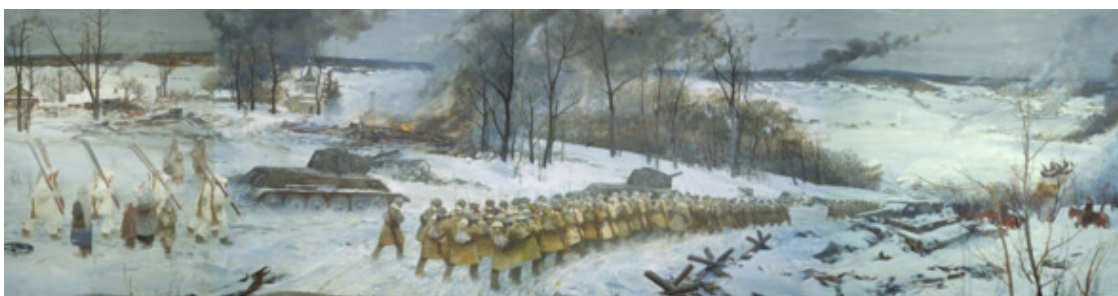
Наступление наших войск. Фрагмент панорамы Перемиловской высоты

Перемиловская высота (Перемиловские высоты) – место боёв во время Великой Отечественной войны (в 1,5 километрах от города Дмитров, в восточной части нынешнего города Яхрома). Такое название это место получило в конце 1941-го, когда здесь с 27 ноября по 5 декабря шли кровопролитные бои, по наименованию деревни Перемилово Дмитровского р-на на левом (восточном) берегу канала имени Москвы (ранее канал Москва – Волга), напротив г. Яхрома, сразу возле моста через канал.