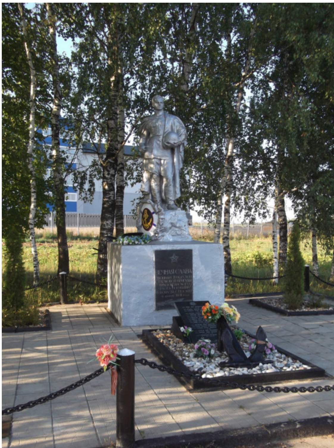
Братская могила на шоссе у д. Парамоново

У нас в восточном Подмоскowie, откуда я родом, боёв в Великую Отечественную не было. Но были вражеские налёты – немцы бомбили некоторые населённые пункты и леса, готовясь к дальнейшему продвижению по кольцу вокруг Москвы и опасаясь формирования партизан-