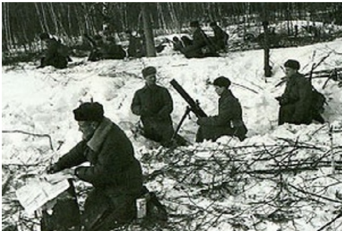
Битва за Перемиловскую высоту

моторизованной дивизий враг устремился к Дмитрову и Яхроме. В Яхроме никто не ожидал появления немцев, к тому же они схитрили. Специально подготовленные диверсанты, переодетые в наше обмундирование, пользуясь темнотой, сняли охрану и захватили мост, что позволило их танкам и пехоте в ночь с 27 на 28 ноября перейти на восточный берег канала.