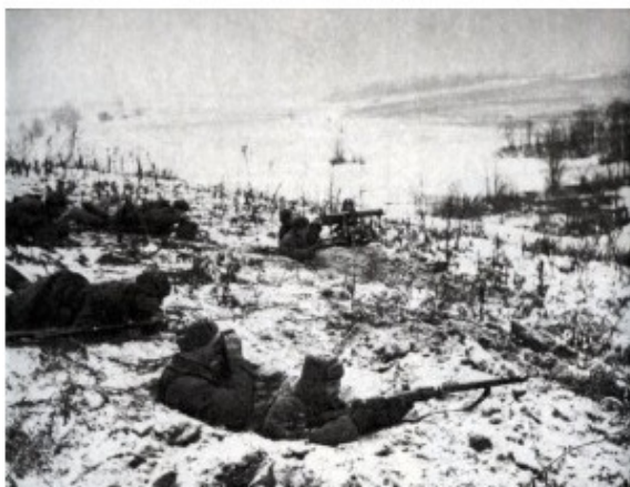
Битва за Москву, декабрь 1941 г