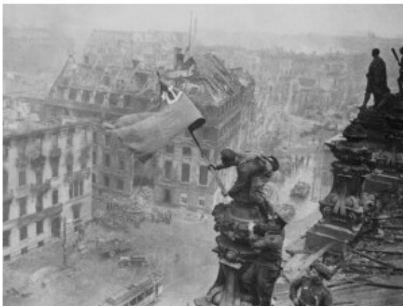
Знамя Победы над Рейхстагом

А вот и красноречивый образ современной народной памяти и символ благодарности защитникам нашей земли.