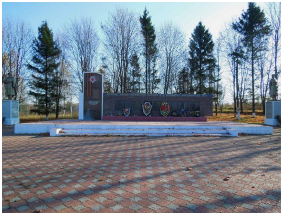
Памятник в Деденево

Поселок Деденево интенсивно бомбился, в здании школы занятой под военный госпиталь погибло много раненных и местных жителей. Оккупирован не был. В критические 10 дней Битвы за Москву во время боёв за деревню Капорки (шесть раз переходила из рук в руки) на северной окраине Деденево у железнодорожного моста были немцы. Северные скаты высот населённого пункта простреливались стрелковым оружием, и они были местом ожесточённых боев. На территории посёлка есть воинские братские могилы – самая большая находится на изгибе Дмитровского шоссе.