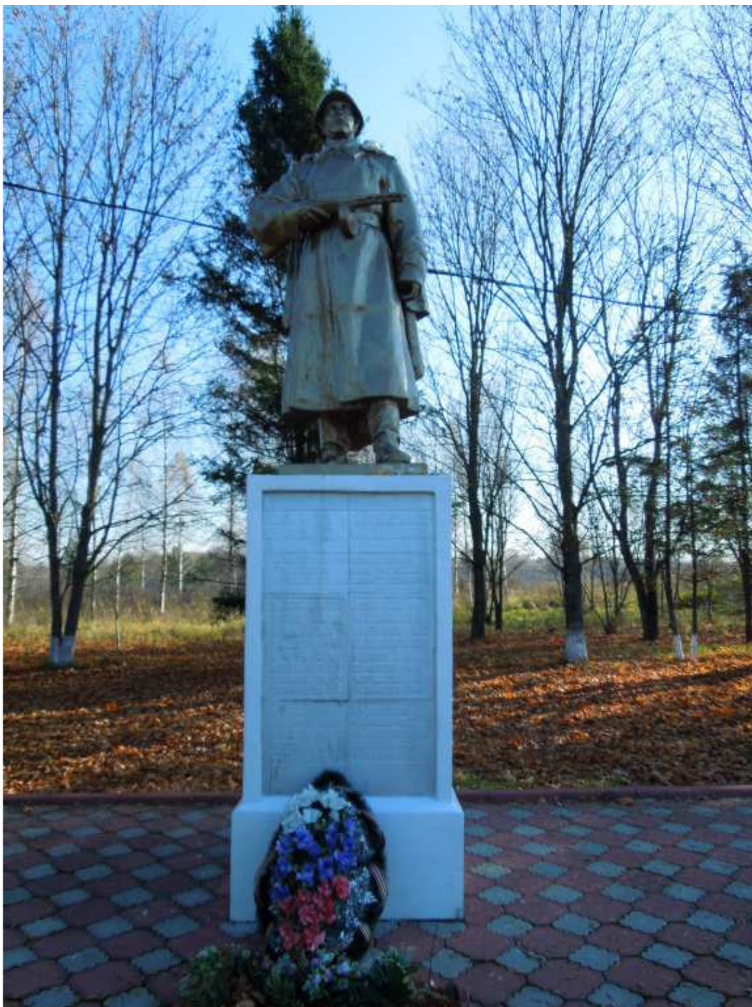
Образ ваш неизвестен. Подвиг ваш бессмертен