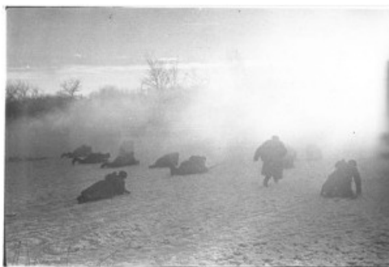
Битва за Москву. Декабрь 1941 года.

На дмитровском направлении действовали 1, 6 и 7 танковые, 14 и 36 моторизованные, а также 23 Потсдамская пехотная дивизии противника. Последняя из них продвигалась вглубь Подмосковья особенно успешно, ведь она принадлежала к так называемым «пехотным дивизиям первой волны» и являлась кадровой дивизией германской армии мирного времени. Кадровые дивизии представляли собой лучшие пехотные соединения из-за качества подготовки личного состава и материально-технического обеспечения. Их командный состав обладал высокой профессиональной подготовкой и отличался слаженностью действий. В составе такой пехотной дивизии числилось порядка 17 700 человек.