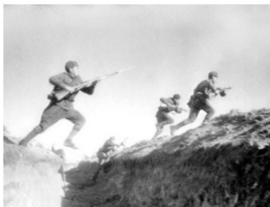
Битва за Москву, декабрь, 1941 г

Мы бросились на пол, всё сотрясалося и гудело, а на нас сверху сыпались вещи, куски штукатурки и стекла. Оцепенение наше было такое, что мы не могли плакать. Также я помню, как к нам приходили раненые. Мои тётки израсходовали все свои простыни на перевязку. Раненые рассказывали, что они из-под деревни Степаново. Под Степановым лежали в снегу, не могли поднять голову, так как немцы, только высунешься, начинали по ним строчить. Питались – кто-то припас в карманах, ели снег, почти не спали. Одного раненого только перевязали – он тут же упал со стула без сил – уснул... Однажды пришли мы в бабушкин дом на Почтовой, уже стемнело. Вдруг слышим железный лязг и грохот по заледеневшей дороге. Посмотрели в окно, а это оказались наши танки! И мы стояли, смотрели на них и плакали от радости».