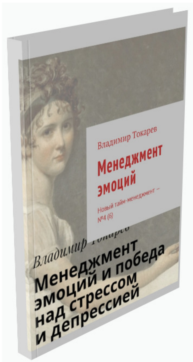
Рис. 3. Продукт краудфандингового проекта.

Акция включает в себя книгу «Менеджмент эмоций. Новый тайм-менеджмент – №4 (6)», содержащую задания практикума по тайм-менеджменту. Это продукт данного краудфандингового проекта.