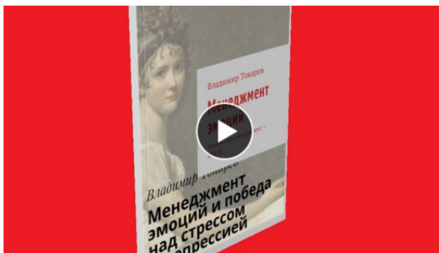
Рис. 1. Книгу лучше всего будет приобрести как акцию краудфандингового проекта.

Лучший (с точки зрения экономической выгоды) вариант приобретения книги «Менеджмент эмоций» – стать акционером проекта краудфандинга по изданию этой книги. Проект будет запущен в феврале 2018 года на платформе «Планета», информация будет в нашем еженедельнике «Русский менеджмент: Революция 2018 года».