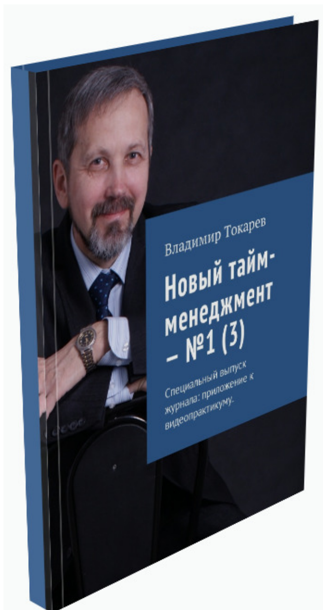
Рис. 7. Книга входит в акцию «Комплект».

Эта книга – продукт уже выполненного проекта краудфандинга.