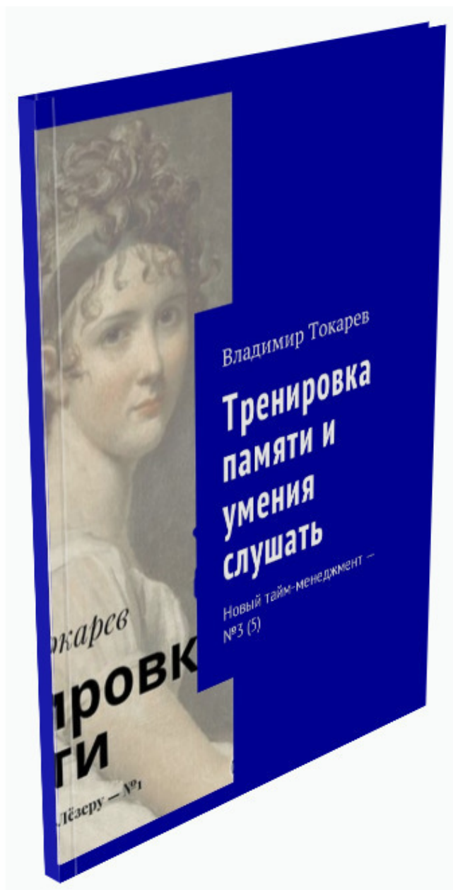
Рис. 2. Продукт краудфандингового проекта.

Акция включает в себя книгу «Тренировка памяти и умения слушать. Новый тайм-менеджмент – №3 (5)», содержащую задания практикума по тайм-менеджменту. Это продукт данного краудфандингового проекта.