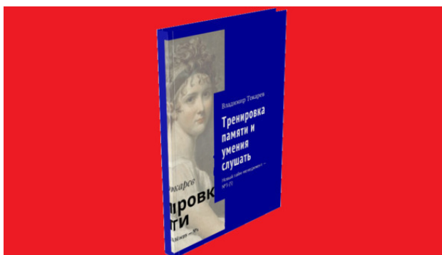
Рис. 1. Книгу лучше всего будет приобрести как акцию краудфандингового проекта.

Лучший (с точки зрения экономической выгоды) вариант приобретения книги «Тренировка памяти и умения слушать» – стать акционером проекта краудфандинга по изданию этой книги. Проект будет запущен в конце марта – начале апреля 2018 года на платформе «Планета», информация будет в нашем еженедельнике «Русский менеджмент: Революция 2018 года».