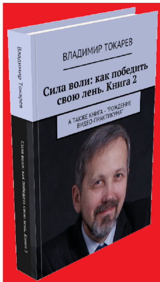
Рис. 6. Книга входит в акцию «Комплект».

Это вторая книга серии по воспитанию силы воли, в ней описываются методы борьбы с ленью.