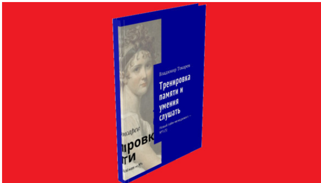
Рис. 1. Книгу лучше всего будет приобрести как акцию краудфандингового проекта.

Книгу лучше всего будет приобрести как акцию краудфандингового проекта.