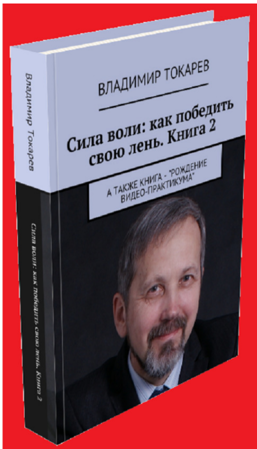
Рис. 6. Книга входит в акцию «Комплект».

Это вторая книга серии по воспитанию силы воли, в ней описываются методы борьбы с ленью.