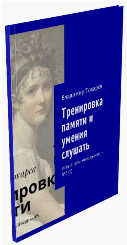
Рис. 2. Продукт краудфандингового проекта.

Одновременно эта книга является приложением к видео-практикуму по новому тайм-менеджменту.