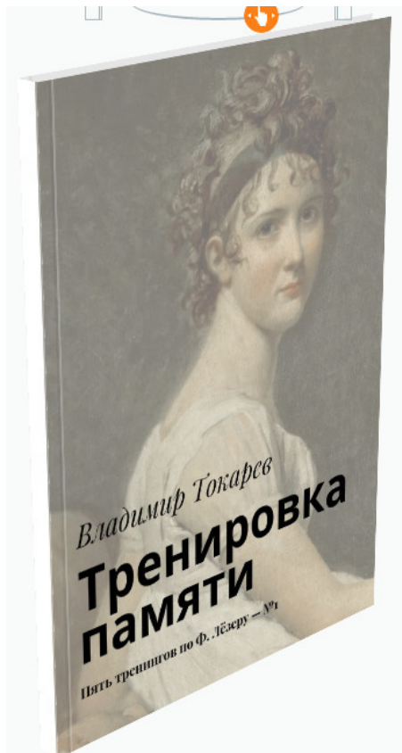
Рис. 4. Книга входит в акцию «Комплект».

В этой книге описана технология по тренировке запоминания Ф. Лёзера, основанная на применении его открытия о том, что запоминание – процесс познавательный.