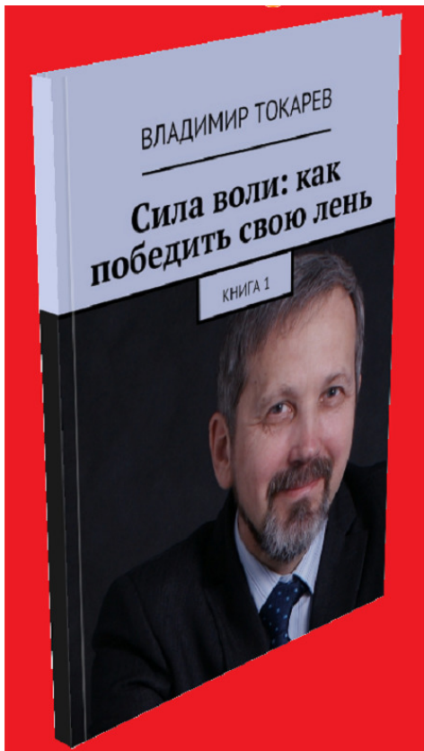
Рис. 5. Книга входит в акцию «Комплект».