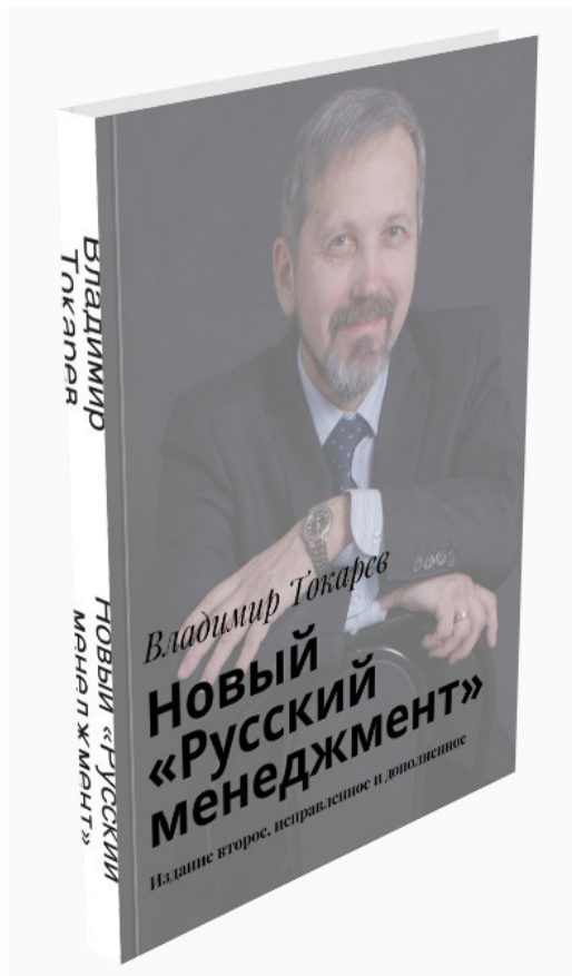
Рис. 3. Бонус к акции «Стандарт».

К этому продукту в качестве бонуса будет прилагаться книга Новый «Русский менеджмент»: