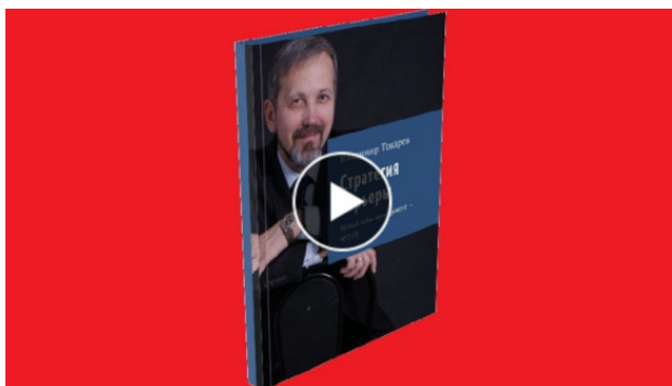
Рис. 1. Выгодный вариант приобретения книги «Стратегия карьеры».

Лучший (с точки зрения экономической выгоды) вариант приобретения книги «Стратегия карьеры» – стать акционером проекта краудфандинга по изданию этой книги. Проект будет запущен середине марта 2018 года на платформе «Планета», информация будет в нашем еженедельнике «Русский менеджмент: Революция 2018 года».