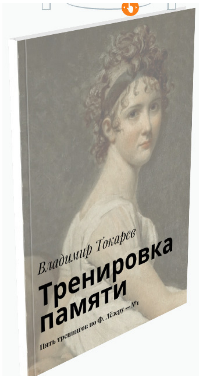
Рис. 5. Книга входит в акцию «Комплект».

В этой книге описана технология по тренировке запоминания Ф. Лёзера, основанная на применении его открытия о том, что запоминание – процесс познавательный.