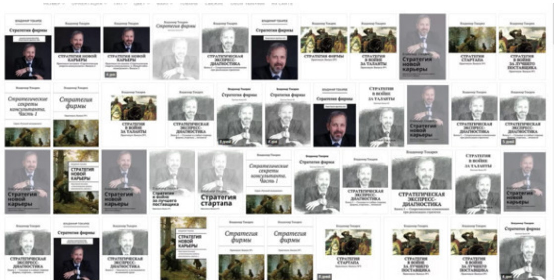
Рис. 3. Книги автора проекта.

Сказки для топ-менеджеров», «Три менеджмента в одном флаконе», «Русский менеджмент», «Стратегическое управление персоналом», «Стратегические секреты консультанта», журналов в книжном исполнении и др., член жюри конкурса в номинации «Лучшая корпоративная стратегия», где принимали участие крупнейшие компании страны – МТС, Северсталь, Уралкалий и др.