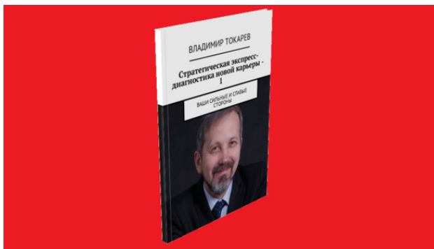
Рис. 4. Эта книга – продукт проекта краудфандинга.

Акция включает в себя книгу «Стратегическая экспресс-диагностика новой карьеры – 1», содержащую задания практикума для самостоятельной разработки стратегии своей карьеры, первый шаг – подготовка списка своих сильных и слабых сторон. Это продукт данного краудфандингового проекта.