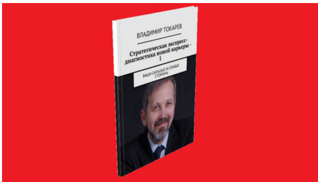
Рис. 4. Эта книга – продукт проекта краудфандинга.

Акция включает в себя книгу «Стратегическая экспресс-диагностика новой карьеры – 1», содержащую задания практикума для самостоятельной разработки стратегии своей карьеры, первый шаг – подготовка списка своих сильных и слабых сторон. Это продукт данного краудфандингового проекта.