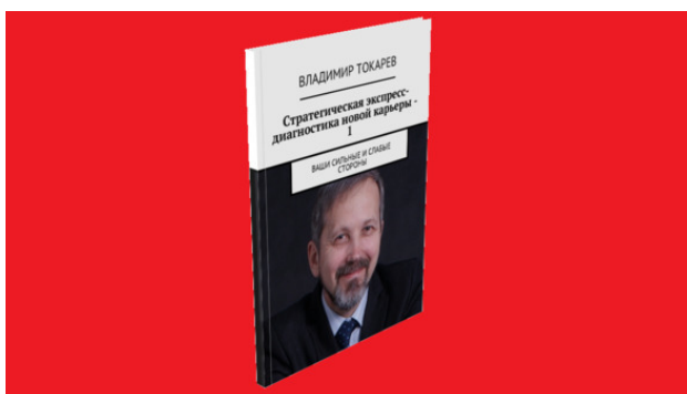
Рис. 1. Книгу лучше приобретать как акцию (вознаграждение) проекта краудфандинга.

Лучший (с точки зрения экономической выгоды) вариант приобретения книги «СТРАТЕГИЧЕСКАЯ ЭКСПРЕСС-ДИАГНОСТИКА НОВОЙ КАРЬЕРЫ» – стать акционером проекта краудфандинга по изданию этой книги. Проект запущен 16 марта 2018 года на платформе «Планета», информация в 21 номере еженедельника «Русский менеджмент: Революция 2018 года».