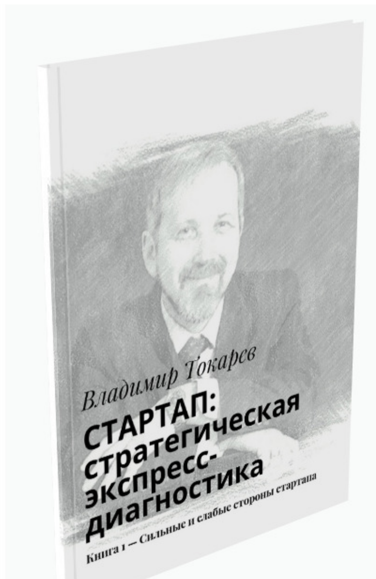
Рис. 3. Серия книг по стратегии стартапа.

Дело в том, что практические задания и др. самые важные материалы в книгах по СЭД по разным темам будут похожи друг на друга, поскольку предлагается использовать одну и ту же проверенную технологию разработки стратегии, просто применительно к разным объектам.