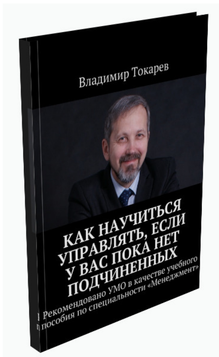
Рис. 4. Второе издание книги по новому тайм-менеджменту, содержит важный параграф о стратегии творческой личности.

– как сферой научных исследований я занялся ТМ на кафедре экономики нижегородского иняза в 1993 году. Результатом НИР – научно-исследовательской работы по ТМ явилась новая концепция ТМ и моя книга «Как научиться управлять, если у вас пока нет подчиненных». Второе издание книги получило гриф УМО вузов России «Учебное пособие по специальности «Менеджмент»: