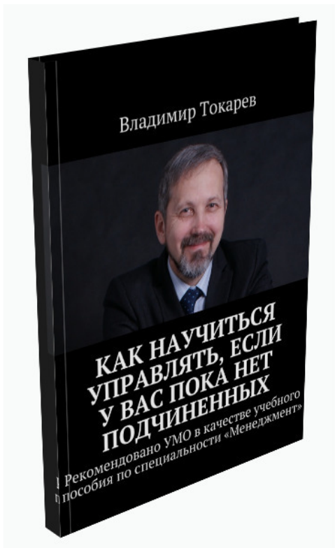
Рис. 4. Второе издание книги по новому тайм-менеджменту, содержит важный параграф о стратегии творческой личности.

Сейчас я директор консультационной фирмы «КЦ «Русский менеджмент», к.т.н., консультант по управлению, ав-