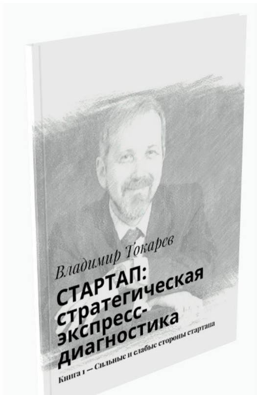
Рис. 3. Серия книг по стратегии стартапа.

Дело в том, что практические задания и др. самые важные материалы в книгах по СЭД по разным темам будут похожи друг на друга, поскольку предлагается использовать одну и ту же проверенную технологию разработки стратегии,