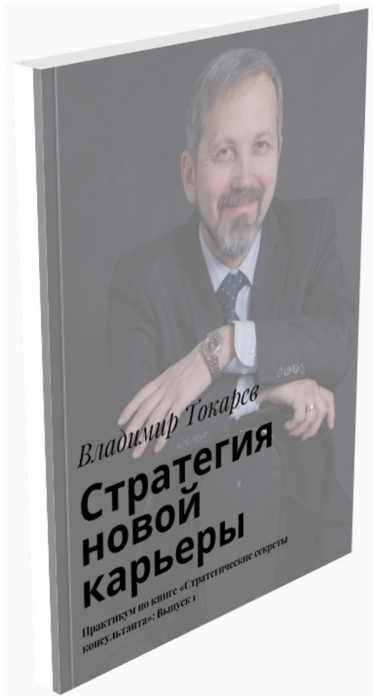
Рис. 8. Первая книга серии «Стратегия новой карьеры».

Книга уже издана. Она описывает правила игры и в ней даются первые задания по разработке стратегии новой карьеры.