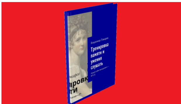
Рис. 5. Одна из книг серии «Новый тайм-менеджмент», издание пятое.

В большом проекте краудфандинга по новому тайм-менеджменту я запланировал издание целых 9 книг: