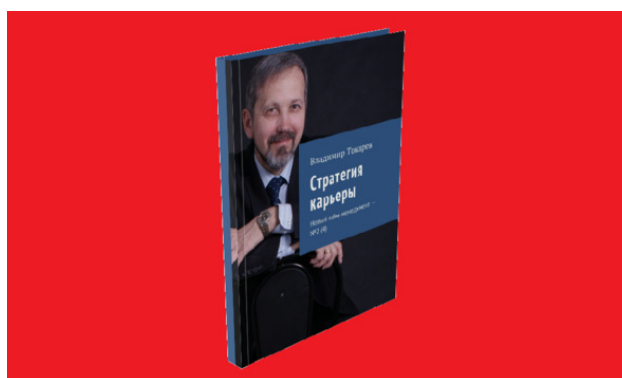
Рис. 2. Это 5 издание серии книг по новому тайм-менеджменту.

– как сферой научных исследований я занялся ТМ на кафедре экономики нижегородского иняза в 1993 году. Результатом НИР – научно-исследовательской работы по ТМ явилась новая концепция ТМ и моя книга «Как научиться управлять, если у вас пока нет подчиненных». Второе издание книги получило гриф УМО вузов России «Учебное пособие по специальности «Менеджмент»: