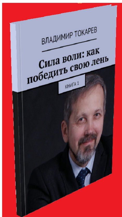
Рис. 7. Одна из трех книг серии «Сила воли: как победить свою лень»