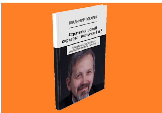
Рис.1. Пример продукта проекта краудфандинга по стратегии карьеры.

– стать акционером одного из проектов краудфандинга по изданию этой или других книг большого проекта.