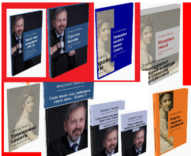
Рис. 6. Пятое издание нового тайм-менеджмента.

В большом проекте краудфандинга по новому тайм-менеджменту я запланировал издание целых 9 книг: