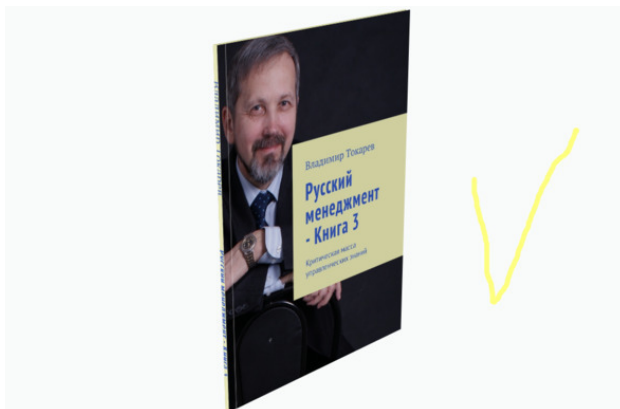
Рис. 1. Продукт проекта краудфандинга – книга.

– стать акционером проекта краудфандинга «Слезть с нефтяной иглы: Русский менеджмент – 3 1 ». Проект запущен в конце апреля 2018 года на платформе «Планета».