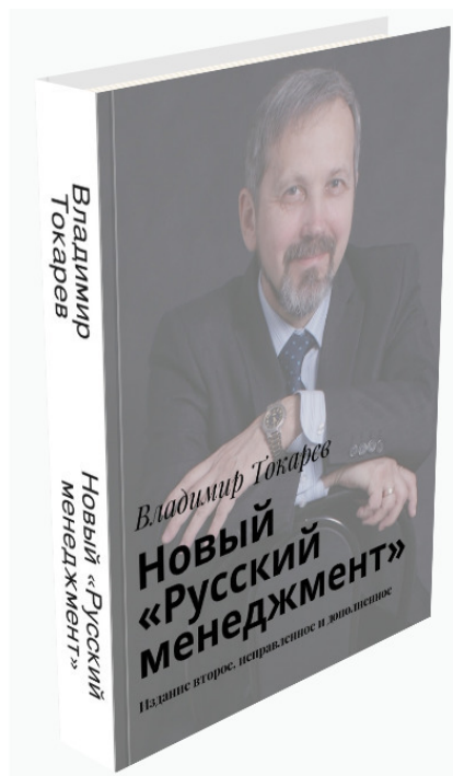
Рис. 3. Улучшенное первое издание книги.

2. После появления на рынке издательства Ридеро, я издал книгу «Русский менеджмент», через некоторое время издал ее улучшенную дополненную версию – Новый «Русский менеджмент» —