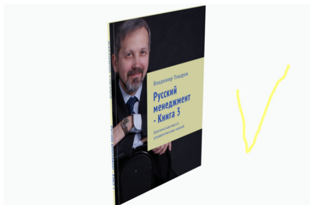
Рис. 6. Продукт данного проекта краудфандинга.

Третьим шагом является цель данного проекта – издание третьей книги этой серии (приложение к ней – глоссарий терминов – уже издано).