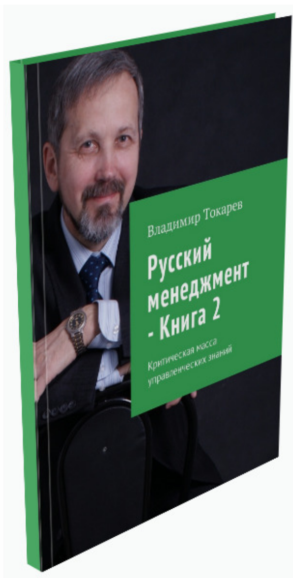
Рис. 5. Вторая книга второго издания.

Третьим шагом является цель данного проекта – издание третьей книги этой серии (приложение к ней – глоссарий терминов – уже издано).