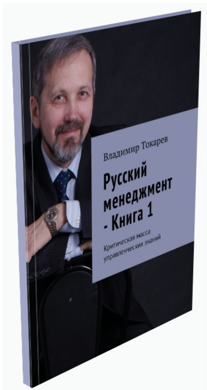
Рис. 4. Второе издание книги.

– разбиение работы на 2 части – сначала подготовить приложения к видеопрактикумам, а уже только затем подготовить сами видеопрактикумы, облегчает работу и позволяет достаточно быстро получить первый результат,