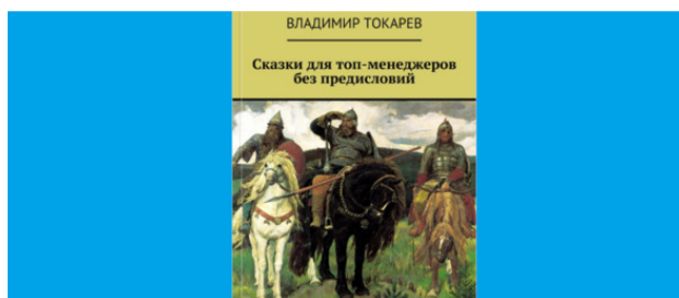
Рис. 1. Присоединяйтесь к нашему проекту и получите не только аудиокнигу, но и в качестве бонуса ее бумажную версию.

Проект будет запущен в начале июня 2018 года на платформе «Планета».