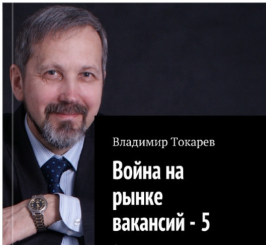
Рис. 1. Продукт проекта краудфандинга – книга.

– стать акционером проекта краудфандинга по изданию этой книги.