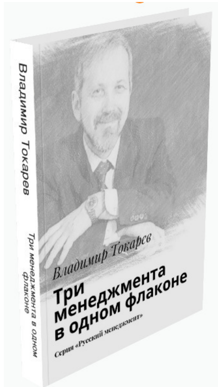
Рис. 6. Технология «три в одном» изложена в этой книге.