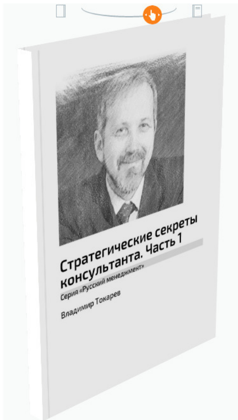
Рис. 5. Эта книга содержит ноу-хау консультирования по вопросам стратегии.