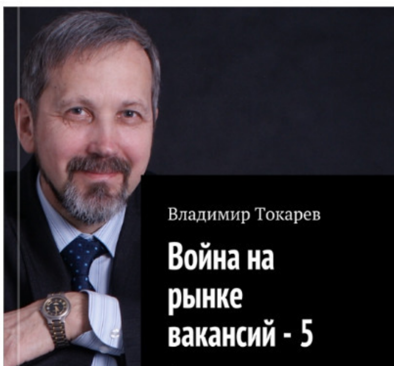
Рис. 1. Продукт проекта краудфандинга – книга.

Лучший (с точки зрения экономической выгоды) вариант приобретения серии книг, помогающих победить в войне на рынке вакансий, в частности, книги «Война на рынке вакансий – 5»,