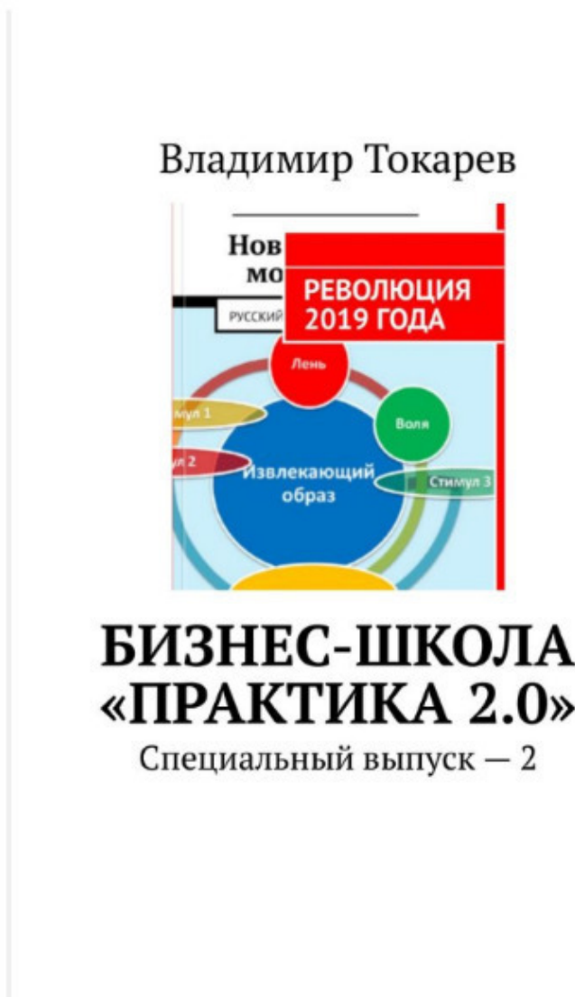
Рис. 3. Вторая книга о нашей бизнес-школе также скачивается бесплатно в магазине издательства «Ридеро».

Федеральное государственное бюджетное образовательное учреждение дополнительного профессионального образования «Нижегородский региональный институт экономики и управления АПК» Бизнес школа «Практика 2.0.»