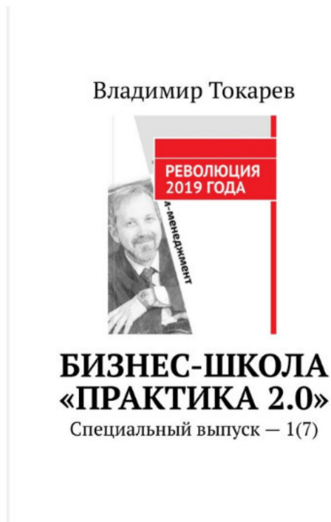
Рис. 2. Приглашение в бизнес-школу будущего.

Буквально у каждой российской компании сегодня есть шанс и достаточное временное окно, чтобы выйти в лидеры (региональные, российские, мировые – все зависит от исходной точки, от которой планируется старт).