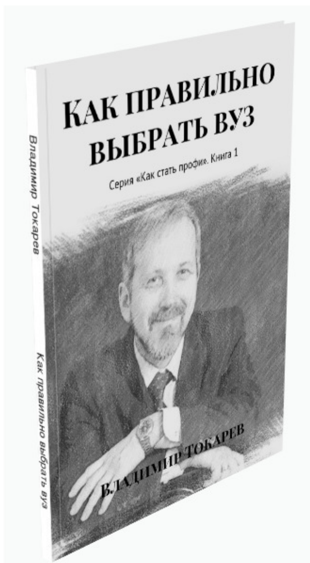
Рис. 6. Книга для абитуриентов и их родителей.

Далее загулы повторялись с завидной регулярностью (например, именно в загуле была написана книга «Пять «Почему?» и др.), и я к ним уже привык.