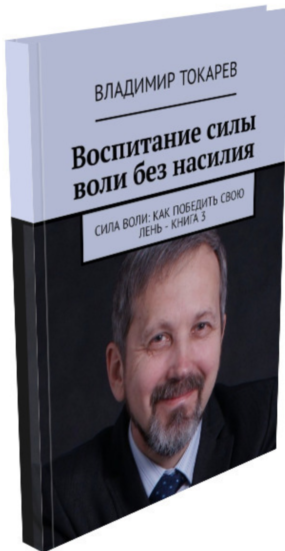
Рис. 8. А стал я, будучи по образованию физиком и кандидатом технических наук, консультантом по управлению и автором книг по менеджменту.