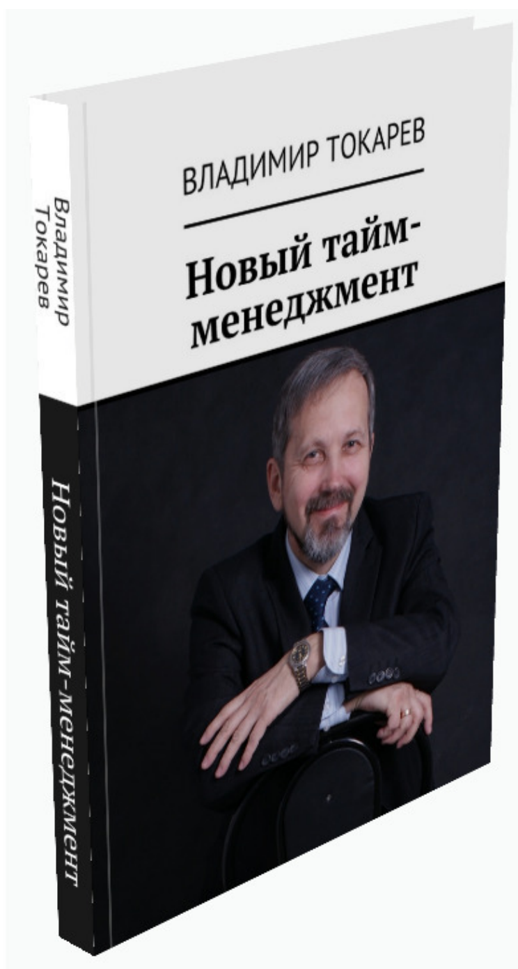
Рис. 5. Фотография автора на обложке – как личное клеймо слесаря 6 разряда.

Удивительно, но книга после такой пластической операции из слабо продаваемых книг перешла в разряд личных бестселлеров. Что касается своего фото, то я подумал – это же у автора что-то вроде как личного клейма слесаря 6 разряда. Вот и стал я в последующем почти все свои книги размещать со своей фотографией. Но не все.