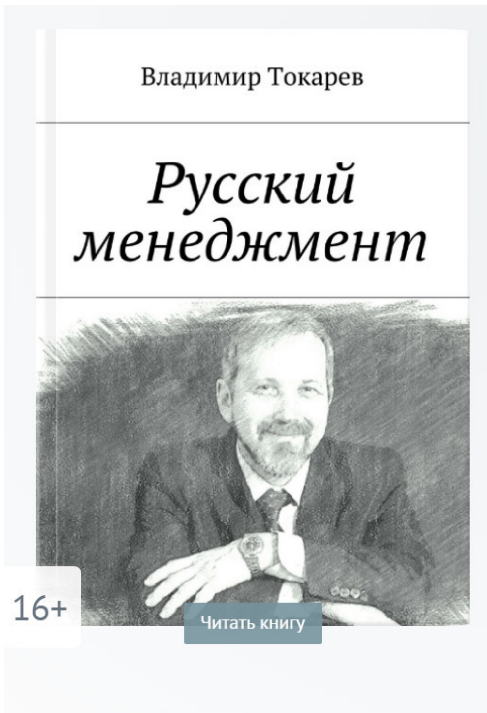
Рис. 3. Книга, в которой есть даже сказки для топ-менеджеров.

Короче говоря, спасибо редактору за идею.