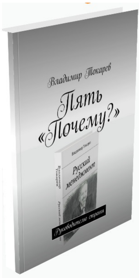
Рис. 7. Книга, отвечающая на вопрос, – Как нам слезть с нефтяной иглы?

И даже увидел пользу – отдыхаешь от того, что что-то не очень пишется (а пишу я, можно сказать, что редко – исключительно когда пишется, как сейчас, например).