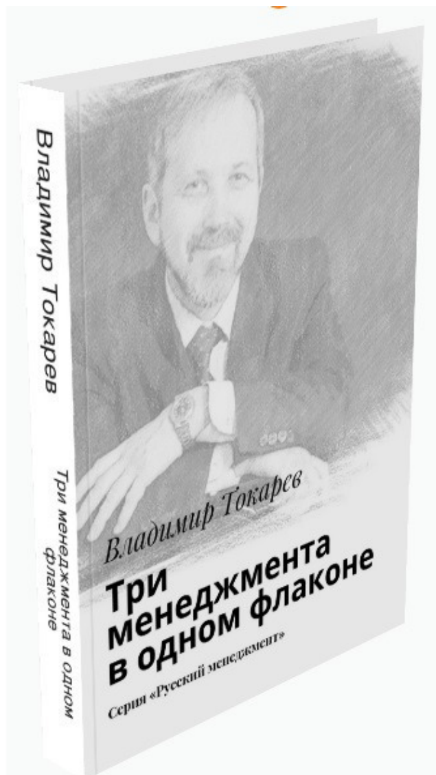
Рис. 2. Книга, в которой есть почти про все. Притом, что книгу можно использовать в трех разных назначениях.

Ну я, конечно же, исправился, и в другой книге – «Русский менеджмент» (замечу самой главной, центральной моей книге по управлению) у меня все главы так и назывались (не буду врать – загляну в оглавление – видите, это настоящий репортаж с места событий (место – это мой любимый диван в кабинете), не выдумка какая-то) —