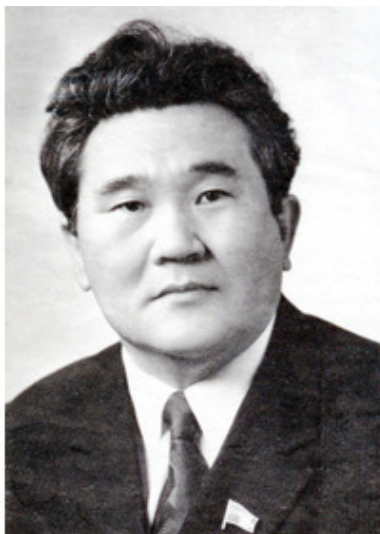
Султан Ибраимов, председатель СМ Киргизской ССР

Сегодня охота была небольшая – охотились только двое. А стая, как назло, попалась достаточно многочисленная – на первый взгляд, не менее 50 голов. Председатель Совмина Киргизии Султан Ибраимович Ибраимов охоту на качкалдаков любил, но стрелял плохо – потому затевал ее только для дорогих друзей, навещавшихся к нему сюда, в санаторий Чолпон-Ата. Обычно это были люди из Москвы или его старый приятель, первый секретарь ЦК Компартии Узбекистана Шараф Рашидович Рашидов. Он и обещал приехать в этот раз, но не смог, прислал вместо себя еще одного их общего друга, министра внутренних дел Узбекистана Хайдара Яхьяева. Тот стреляет, конечно, хорошо, но все равно всех им вдвоем не перебить, много слишком. Потому сегодня все егеря и лесники вышли на охоту вместе с сановным начальством – как знать, может выгорит подстрелить пару жирных лысух, вот и будет праздник для семейства.