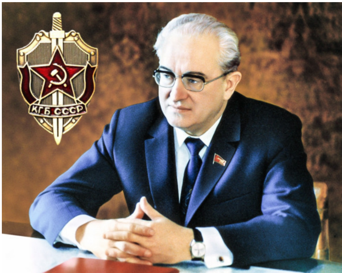
Юрий Владимирович Андропов, председатель КГБ СССР

Сегодня же, в пику обычно приподнятому настроению, сопровождавшему Андропова после свиданий с Мельпоменой, он вышел из здания МХАТа имени Чехова в компании своего заместителя Чебрикова в подавленном состоянии. Вышел – и посмотрел на небо. Среди непроглядной темноты виднелись тучи, которые не обещали ничего хорошего. Видавшему виды, хоть и не коренному, москвичу казалось в такие минуты, что лето и впрямь никогда не наступит. Вдобавок к отвратительной погоде неприятный осадок оставил сам спектакль – давали «Свадьбу Кречинского».