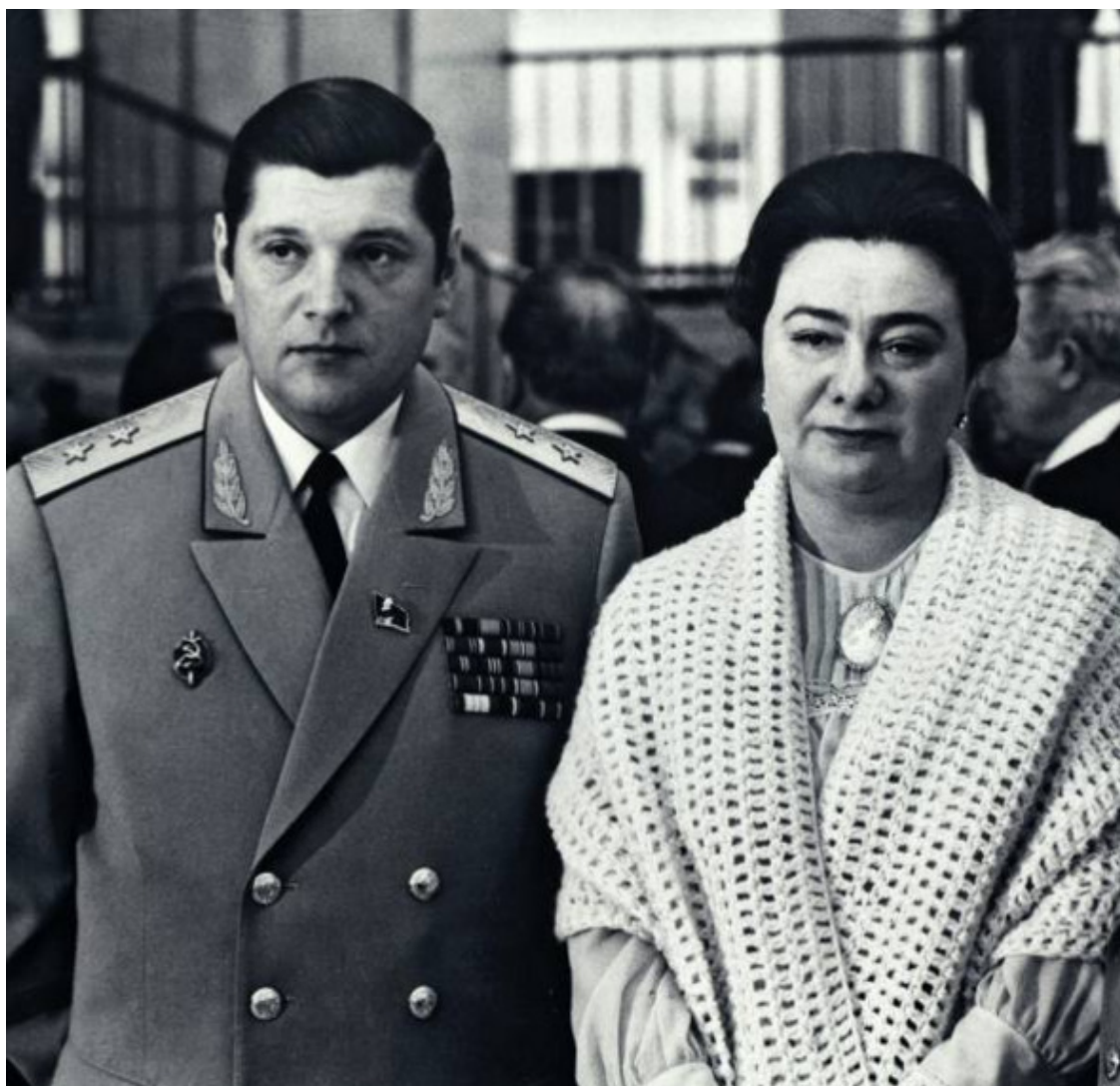
Юрий Чурбанов с женой – Галиной Брежневой