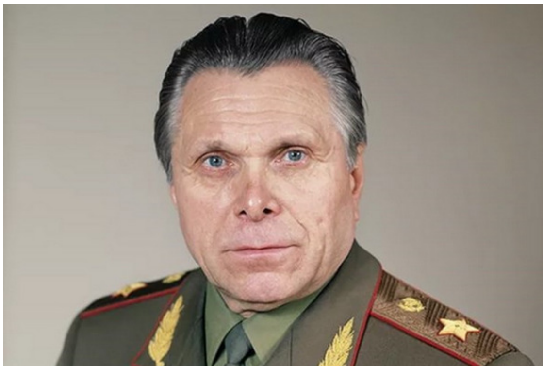
Николай Анисимович Щелоков, министр внутренних дел СССР

Совещание у министра внутренних дел СССР Николая Анисимовича Щелокова подходило к концу. Общие сводки, цифры, результаты работы, краткие отчеты по наиболее резонансным делам. Министр дополнительно проверил условия содержания в некоторых ИТУ Украины, результатами проверки остался недоволен и поручил начальникам отделов провести дополнительную инспекцию, после чего объявил, что все члены коллегии Министерства свободны, попросив остаться двух своих заместителей – Крылова и Папутина.