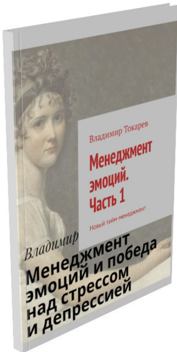
Рис. 2. Первая часть книги по менеджменту эмоций.

(точнее, мы ждем, когда одна из социальных сетей примет/не примет решение о размещении на своих ресурсах важного отрывка из первой части).