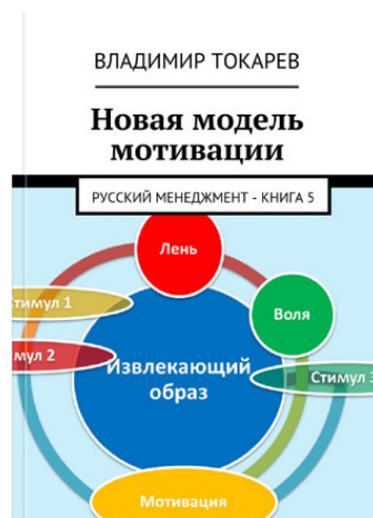
Рис. 4. Одна из книг серии «Русский менеджмент», включает в себя три книги по борьбе с ленью

Любозн. генир – А насколько серьезно нужно знать психологию, чтобы грамотно управлять?