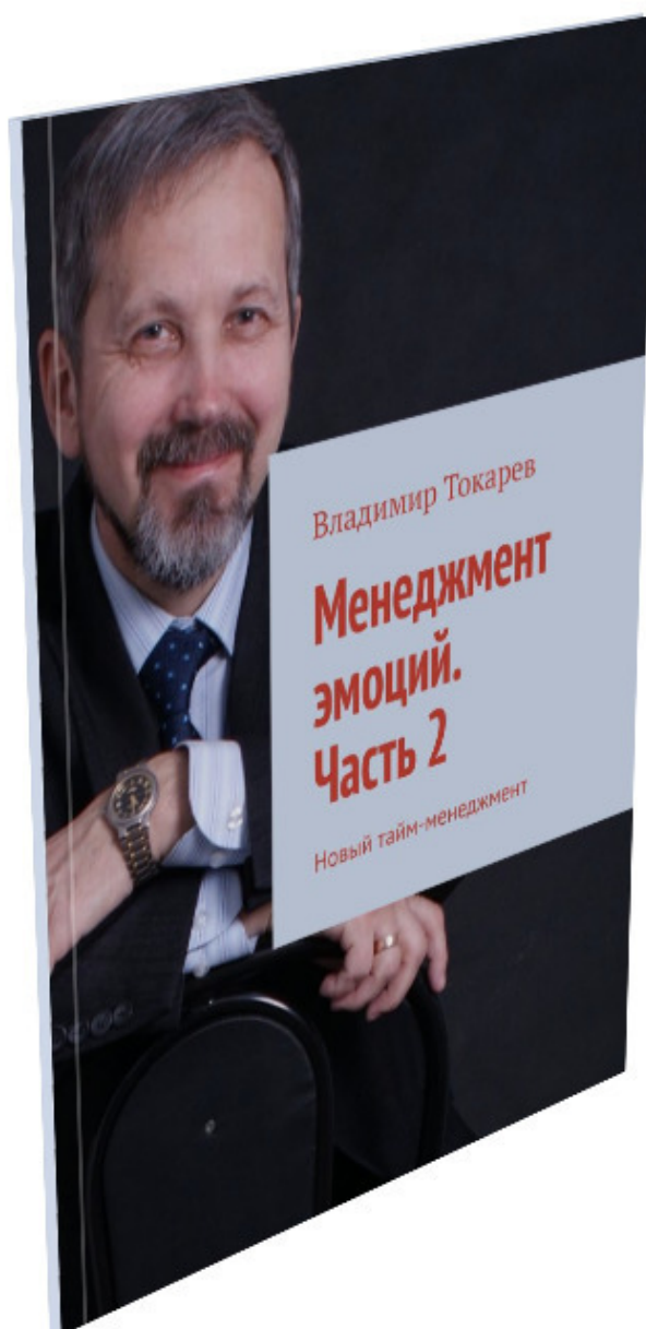
Рис. 3. Вторая часть книги по менеджменту эмоций.