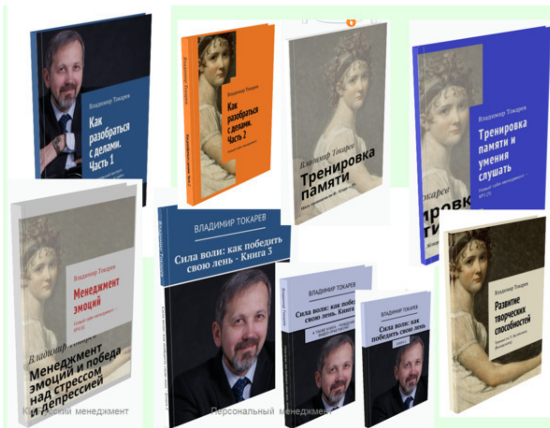
Рис. 1. Серия практикумов по новому тайм-менеджменту.

Лучший (с точки зрения экономической выгоды) вариант приобретения книги «Менеджмент эмоций» – стать акционером (спонсором) проекта краудфандинга по изданию серии из 9 книг по новому тайм-менеджменту – и получить соответствующие выгодные вознаграждения (книги со скидкой до 50%).