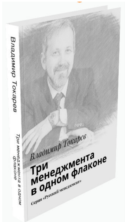
Рис. 9. Третье издание книги по новому тайм-менеджменту.

Сейчас я директор консультационной фирмы «КЦ «Русский менеджмент», к.т.н., консультант по управлению, автор более 50 статей по менеджменту в профильных журналах, автор более 100 книг —