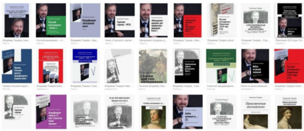
Рис. 10. Книги автора.

Сказки для топ-менеджеров», «Три менеджмента в одном флаконе», «Русский менеджмент», «Стратегическое управление персоналом», «Стратегические секреты консультанта», журналов в книжном исполнении и др., в 2012—2017 гг. член жюри конкурса в номинации «Лучшая корпоративная стратегия», где принимали участие крупнейшие компании страны – МТС, Северсталь, Уралкалий и др.