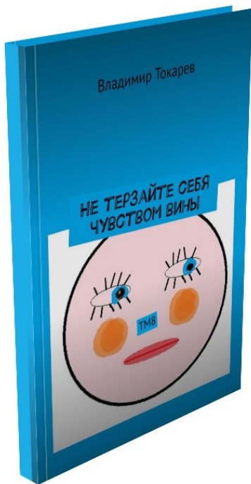
Рис. 6. Предпоследняя книга серии «Эмоции в розницу».