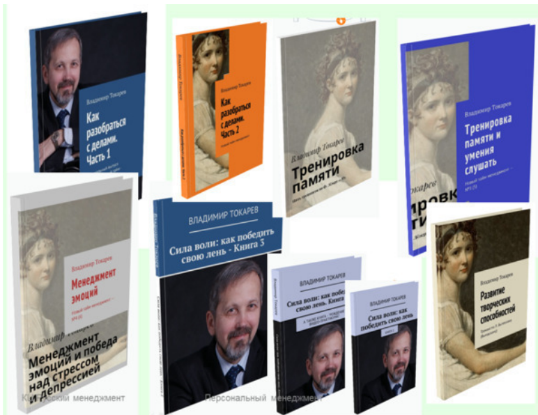
Рис. 1. Серия практикумов по новому тайм-менеджменту.

ВНИМАНИЮ ЧИТАТЕЛЕЙ! Вы можете присоединиться к проекту по ссылке https://planeta.ru/campaigns/tm_9books