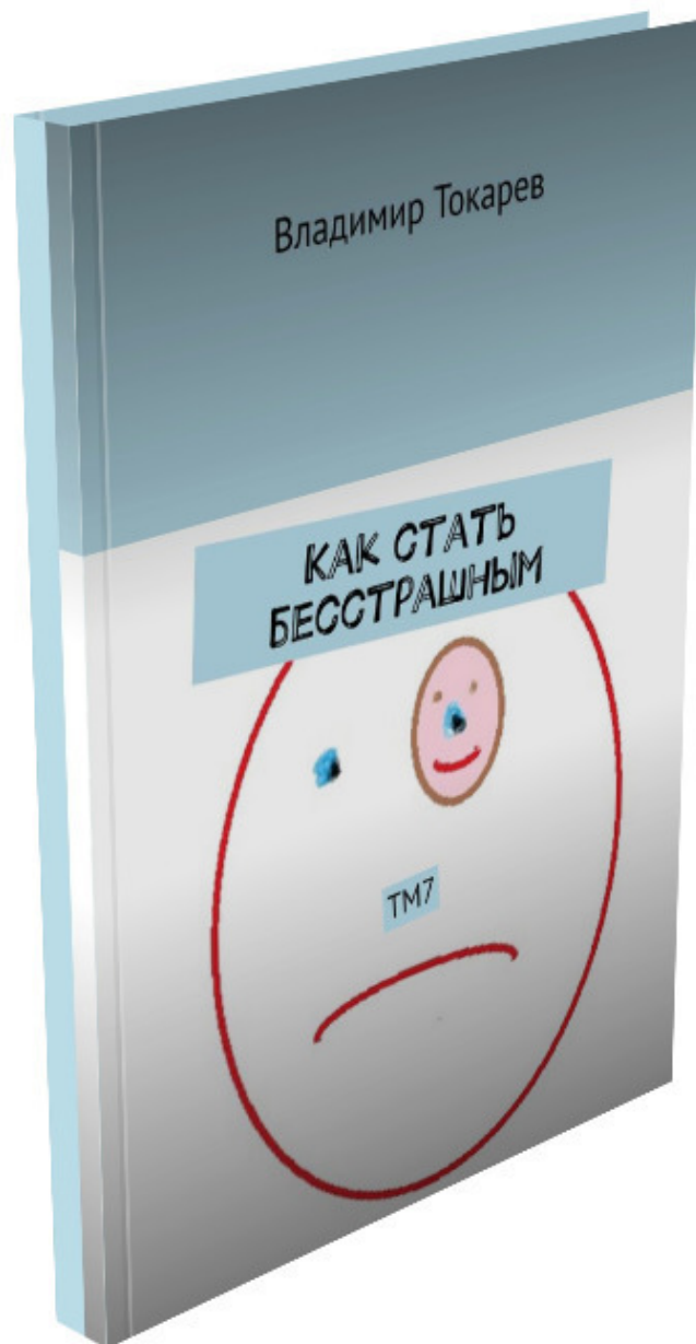
Рис. 5. Книга, которую вы читаете.

И вот наконец эта книга, которую задерживало издание статьи.