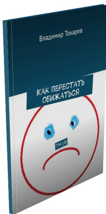
Рис. 2. Первая эмоция, «продаваемая в розницу», предлагается в 4 номере журнала «Новый тайм-менеджмент».

Первая эмоция – «Как перестать обижаться» уже издана и ждет своего читателя.