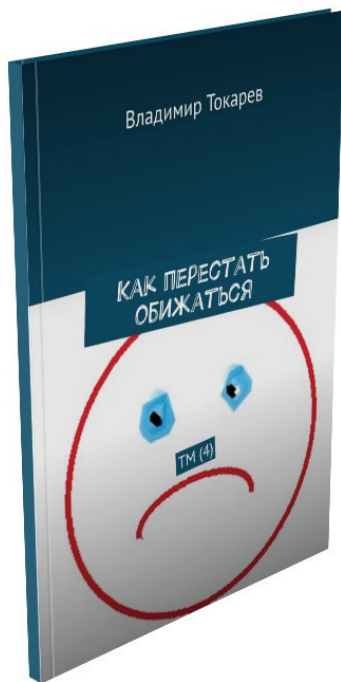
Рис. 2. Первая эмоция, «продаваемая в розницу», предлагается в 4 номере журнала «Новый тайм-менеджмент».

Второй эмоцией в розницу планировалось описание чувства вины, а следом книжка про эмоцию стыда.