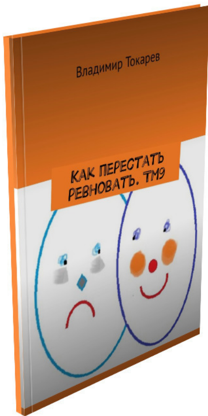
Рис. 6. Последняя книга серии «Эмоции в розницу».

Но это предпоследняя книга серии, поскольку еще предстоит подготовить и издать 6 книгу – про ревность —