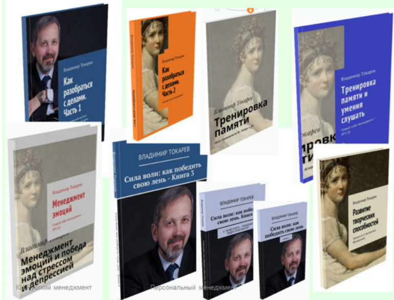
Рис. 1. Серия практикумов по новому тайм-менеджменту.

ВНИМАНИЮ ЧИТАТЕЛЕЙ! Вы можете присоединиться к проекту по ссылке https://planeta.ru/campaigns/tm_9books