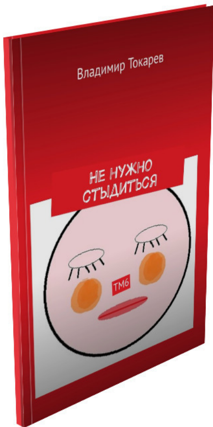
Рис. 4. Третья «эмоция, продаваемая в розницу», предлагается в 6 номере журнала «Новый тайм-менеджмент».

А поскольку в книге про менеджмент эмоций, что явля-