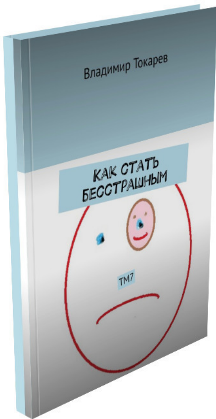
Рис. 5. Книга, которую вы читаете.

И вот наконец эта книга, которую задерживало издание статьи.