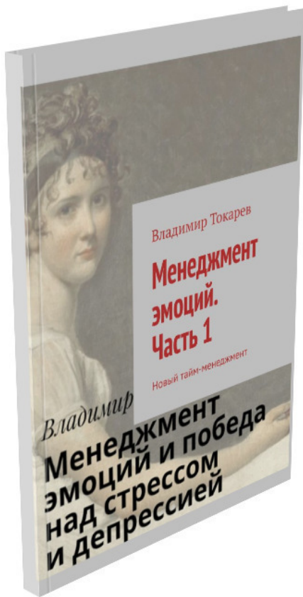
Рис. 2. Первая версия обложки первой части.

А следом были изданы «эмоции в розницу», всего их 6 – по 3 в каждой части книги.