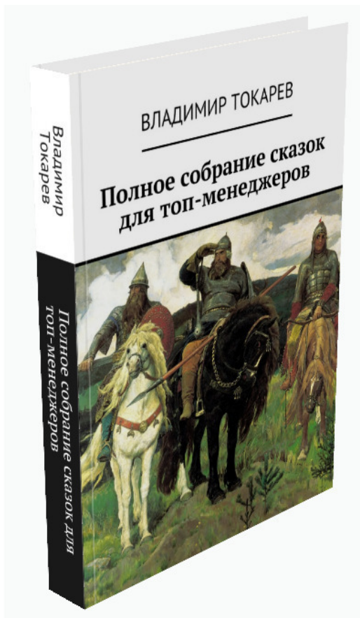
Рис. 7. Книга, содержащая сказки для топ-менеджеров,