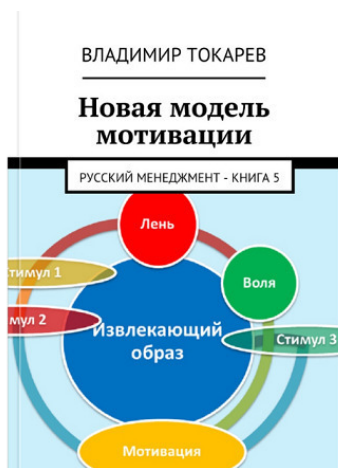
Рис. 5. Одна из книг серии «Русский менеджмент», включает в себя три книги по борьбе с ленью

Любозн. гendir. – А насколько серьезно нужно знать психологию, чтобы грамотно управлять?