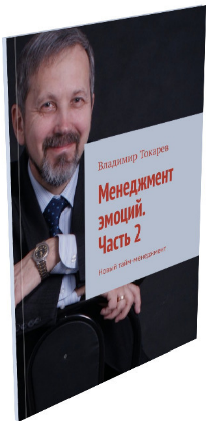
Рис. 3. Вторая часть книги по менеджменту эмоций.