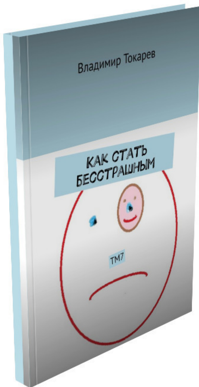
Рис. 5. Книга, которая пользуется особым спросом у читателей.

Ну а я, двигаясь к финишу, тем временем издал еще одну книгу серии «Эмоции в розницу» – про страх, было, конечно страшновато, не скрою.