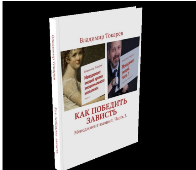
Рис. 8. Книга, которая будет бонусом для спонсоров проекта.

Итак, проект выполнен. Все книги изданы. Но, однако, эмоции остались. Тогда было принято решение издать для спонсоров проекта еще одну книгу – по управлению завистью – она идет дополнительным бонусом ко всем вознаграждениям.