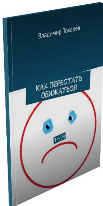
Рис. 2. Первая эмоция, «продаваемая в розницу», предлагается в 4 номере журнала «Новый тайм-менеджмент».

Первая эмоция – «Как перестать обижаться» уже издана и ждет своего читателя.