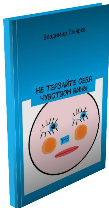
Рис. 6. Книга, которую задерживала публикация статьи на тему.

И вот, наконец, издана книга про борьбу с чувством вины, которую задерживало издание статьи.