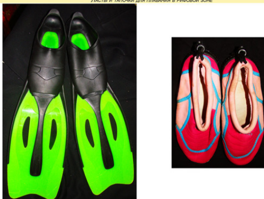
Ласты и тапочки для плавания в рифовой зоне

Для всех должно быть правилом, что после захода солнца купаться в теплых морях, типа Красного, запрещено, так как именно в это время активизируются и выходят на охоту множество опасных и смертельно ядовитых морских обитателей. В Египте отдыхающие рассказывают друг другу историю о том, как турист в последний день решил окунуться после захода солнца. До сих пор гадают, какой ядовитый морской обитатель укусил его. Однако факт остается фактом, этот отдыхающий не выжил.