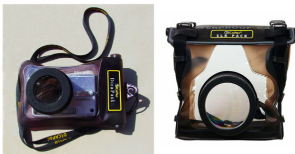
Фотоаппараты и мягкие боксы с глубиной погружения до 3-х метров

Наиболее простыми, дешевыми и доступными являются мягкие боксы типа герметичных мешков и пакетов, сделанных из эластичного пластика или резины. Все они имеют встроенные круглые окна, не искажающие изображение в пределах средней, а иногда и высокой чувствительности. На первой фотографии представлены два таких мягких бокса. Их глубина погружения составляет от 1 до 3-х метров. Эти мешки изготавливаются разных размеров, их цена варьирует от 1 до 4 тысяч рублей. Такой техникой пользуются любители плавать с ластами и маской, которые могут нырять на глубину до 3-х метров. В эти мягкие боксы можно размещать фотоаппараты с различными параметрами, даже с высокой светосилой и чувствительностью.