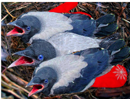
Птенцы вороны в гнезде на varejках