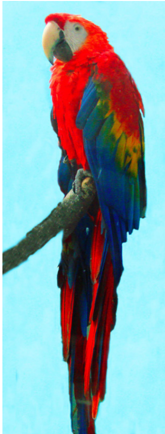
Попугай ара на корабле

с красно-бардовым платочком, сине-зелеными боковыми перьями и длинным двухцветным красно-синим хвостом.