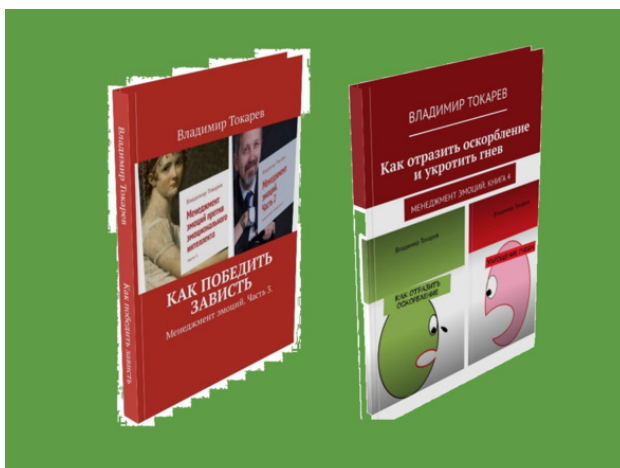
Рис. 1. Книги в магазине издательства Ридеро всегда дешевле.

Лучший (с точки зрения экономической выгоды) вариант приобретения книг по управлению эмоциями, воспитанию силы воли и любым другим темам – приобретать их в магазине издательства Ридеро —