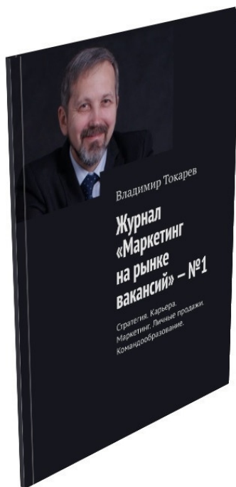
Рис. 2. Наш новый журнальный проект.

Запущен новый журнальный проект – «Маркетинг на рынке вакансий» —