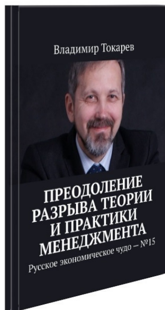
Рис. 8. Для ускорения подготовки книги запущен новый журнальный проект.

Итак, о том, как будет идти работа по подготовке проекта краудфандинга (КФ) и книги я буду рассказывать в этой серии репортажей.