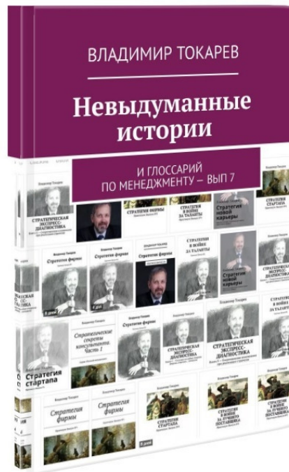
Рис. 6. В ближайших планах издание еще 2 книг этой серии.

Кроме ребрендинга этой серии книг, удалось выпустить три новые книги этой серии —