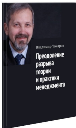
Рис. 7. Издание этой бесплатной книги планируется как проект краудфандинга.