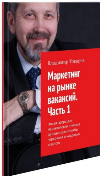
Рис. 4. Издано уже три части (три книги).

По материалам этого нового журнального проекта началось издание книги в 4 частях – «Маркетинг на рынке вакансий» —