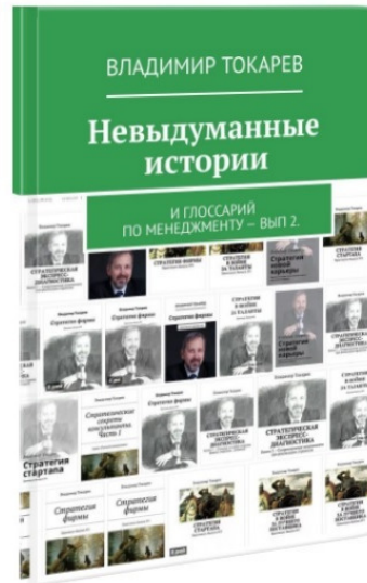
Рис. 5. Эта серия книг является приложением ко второму изданию «Русского менеджмента».

Кроме ребрендинга этой серии книг, удалось выпустить три новые книги этой серии —