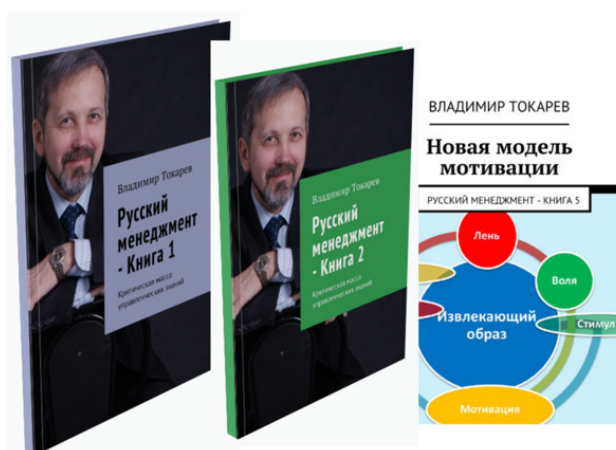
Рис. 1. Серия из 9 книг.

Вы хотите повысить конкурентоспособность вашего бизнеса за счет изменения практики управления? Тогда для вас серия из 9 книг – «Русский менеджмент».