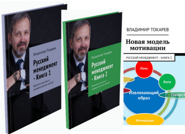
Рис. 1. Серия из 9 книг.

Лучший (с точки зрения экономической выгоды) вариант приобретения книг по управлению и любым другим темам – приобретать их в магазине издательства Ридеро.