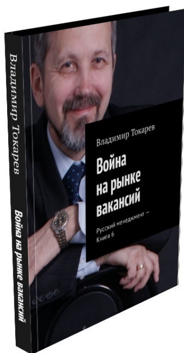
Рис. 2. Книга, содержащая концепцию рынка вакансий.