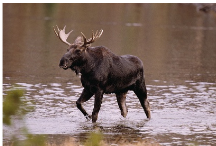
Сибирский лось – «Сохатый»

За поворотом открылся очередной перекаат. Нюкжин хотел подать очередную команду, как вдруг увидел сохатого. Тот стоял на косе, повернув голову в сторону лодки. Мощная грудь, мощная шея. Лишь рога молодые, не по габаритам владельца, им еще расти и расти. Сохатый невозмутимо смотрел, как из-за поворота выплывает что-то незнакомое, но не шевелился. Когда же лодка приблизилась, тронулся с места и ускоренным шагом затрусил вперед, к перекаату.