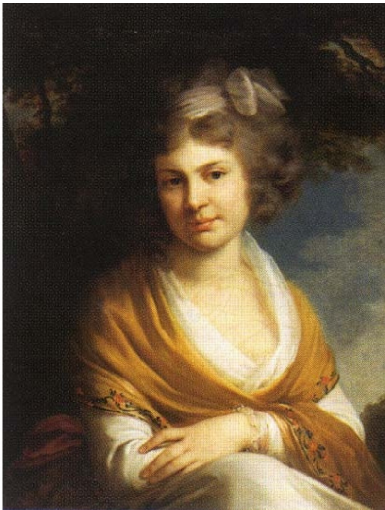
Лампи Иоганн-Батист. Наталия Суворова. Музей-заповедник «Ростовский кремль»