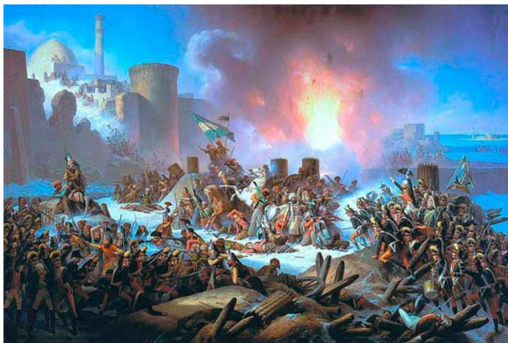
Януарий Суходольский. Штурм Очаково 6 декабря 1788 года