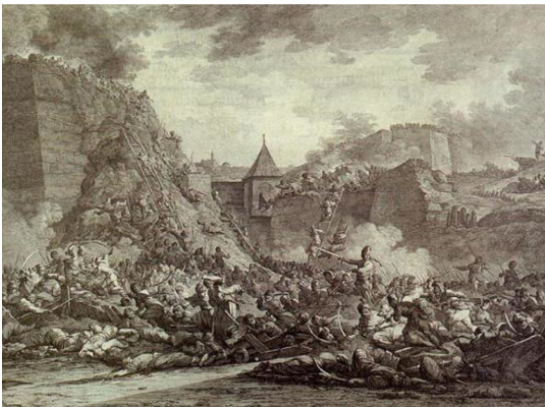
Гравюра А. Берга. Штурм крепости Очаков

Метели плясали, морозец трескучий, Колоннами наши на штурм подались. Картечь покусала, порывом могучим, Колоннами наши за жизнь поднялись!