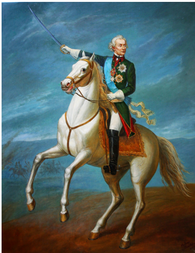
Ф. А. Москвин. Генералиссимус Суворов