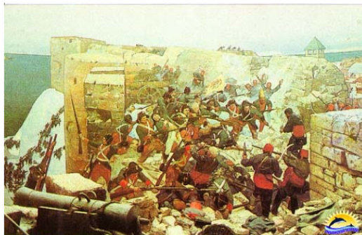
М. И. Самсонов. Штурм крепости Очаков