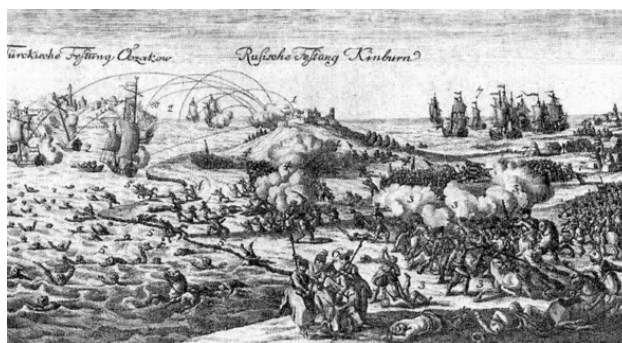
Гравюра Иоганна Мартина Билля. Кинбурнская баталия 1787

У Кинбурна 5 крепость большую видали, Суворов командовал войском сейчас, У Кинбурна тактикой смелость придали, Аншеф-генерал 6 , он подумал ни раз!