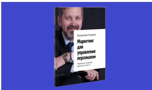
Рис. 1. Издание последней книги серии «Маркетинг на рынке вакансий» является содержательной целью данного проекта краудфандинга.

Приглашаю в проект по изданию серии книг «Маркетинг на рынке вакансий» в рамках новой концепции управления персоналом. Совершим русское экономическое чудо вместе!