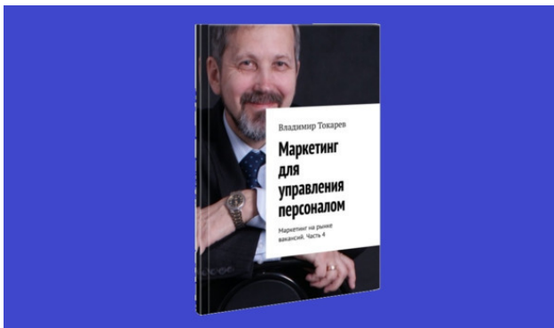
Рис. 1. Издание последней книги серии «Маркетинг на рынке вакансий» является содержательной целью данного проекта краудфандинга.

Присоединяйтесь к нашему проекту краудфандинга! Участвуйте в этом проекте, и вы получите проверенные практикой инструменты для ускоренного накопления критической массы управленческих знаний для победы в конкурентной борьбе и/или для личного самосовершенствования.