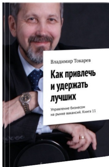
Рис. 6. С 11 по 15 том – это сборники книг для будущего – работе бизнеса на новом для бизнеса рынке вакансий.

«Лекарство будущего» (ЛБ – 11 – 14/15) против экономических последствий пандемии включает в себя третий пятитомник собрания сочинений в формате pdf, он посвящен вопросам новой практики управления персоналом. В первую очередь, это книги: