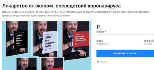
Рис. 1. Заставка проекта краудфандинга

Приглашаю в проект «Лекарство от экономических последствий коронавируса» по изданию собрания сочинений в 21 томе (20 томов уже издано). Победим экономические последствия пандемии вместе!