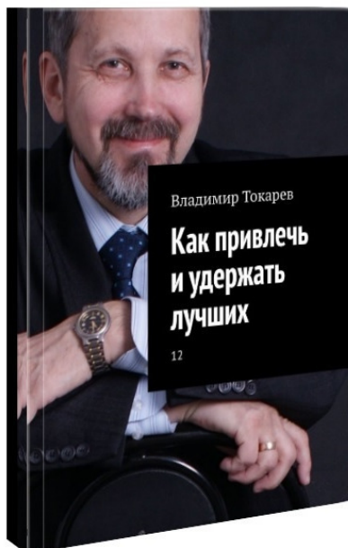
Рис. 7. Двенадцатый том собрания сочинений.