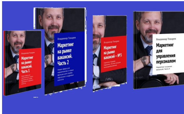
Рис. 8. Это книги, которые войдут в 15 том – цель проекта. 3 из них уже изданы.

а также полезный словарь терминов по менеджменту.