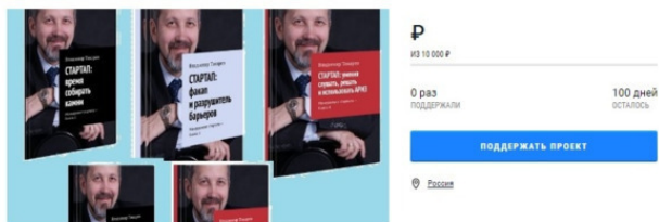
Рис. 1. Заставка проекта краудфандинга

Издание собрания сочинений по менеджменту в 21 томе, позволяющие преодолеть неблагоприятные экономические последствия кризиса, который принес коронавирус. Уже издано 20 томов.