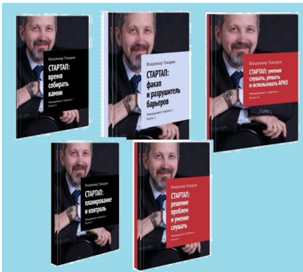
Рис. 4. Сборники книг по менеджменту, которые положили начало собранию сочинений автора.