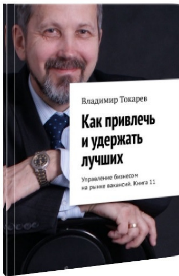
Рис. 6. С 11 по 15 том – это сборники книг для будущего – работе бизнеса на новом для бизнеса рынке вакансий.