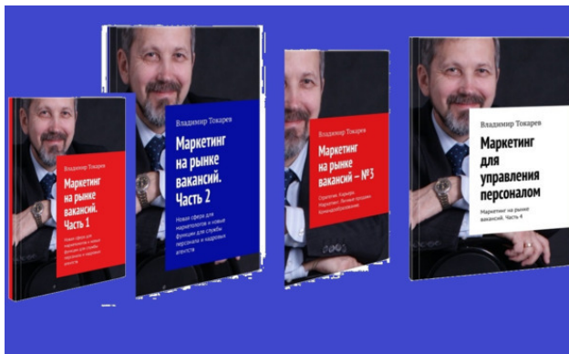
Рис. 8. Это книги, которые войдут в 15 том – цель проекта. 3 из них уже изданы.

а также полезный словарь терминов по менеджменту.