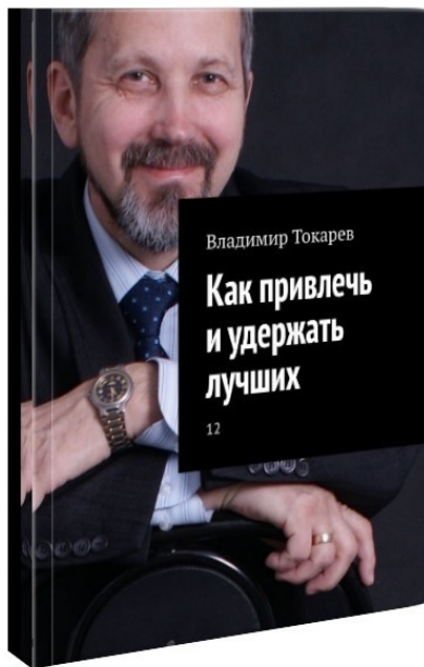
Рис. 7. Двенадцатый том собрания сочинений.