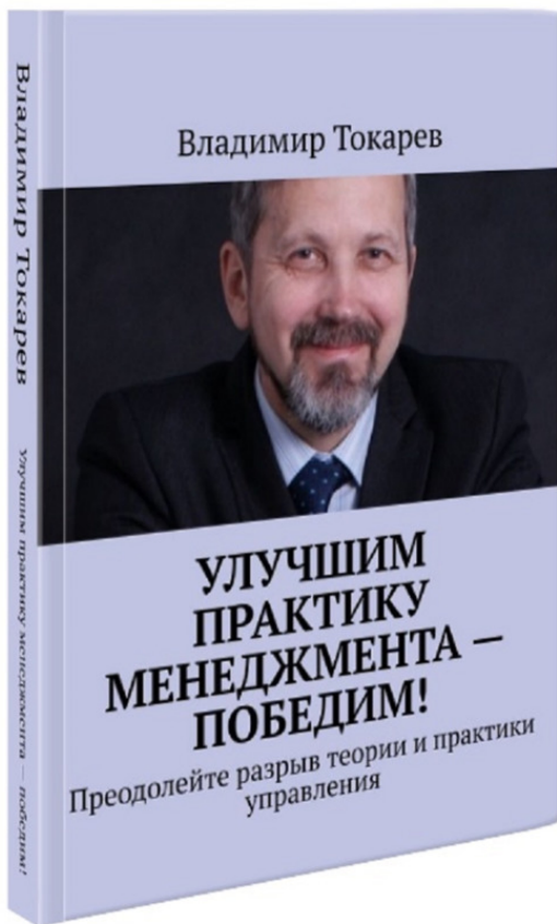
Рис. 3. «Главная» книга автора.