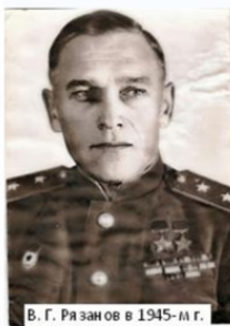
В. Г. Рязанов в 1945-м г.