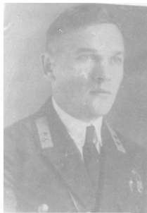
1935 год. Рязанов в ВВА.