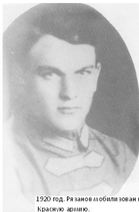
1920 год. Рязанов мобилизован в Красную армию.