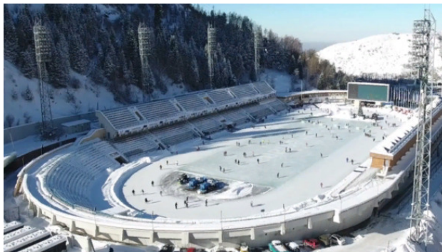
Спортивный комплекс Медео

Спортивный комплекс Медео построен в горном урочище Медео на высоте 1 690 метров около города Алма-Аты в Казахстане. Медео являлся самым высокогорным комплексом в мире для зимних видов спорта с самой большой площадью искусственного ледового катка – 10 500 кв. м. Высокогорье и чистейшая вода для заливки льда способствуют достижению высоких результатов в конькобежном спорте.