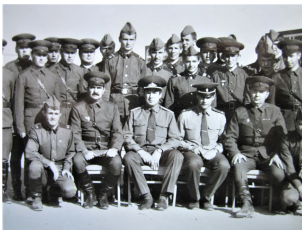
Боевой расчёт Вологодского полка

Подводя итоги своего посещения, генерал сказал, что ему всё понравилось, что отдохнул хорошо: почаще бы так стреляли и... так отмечали победу.