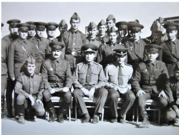
Боевой расчёт Вологодского полка

Подводя итоги своего посещения, генерал сказал, что ему всё понравилось, что отдохнул хорошо: почаще бы так стреляли и... так отмечали победу.