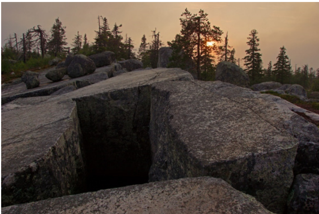
Рис. 21. Воттоваара, Карелия [65]