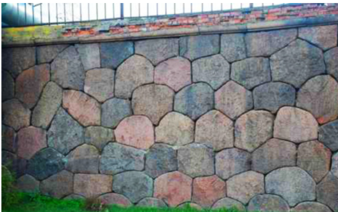
Рис. 18. Кронштадт. Западная стена в районе Кронштадтского шоссе [68]