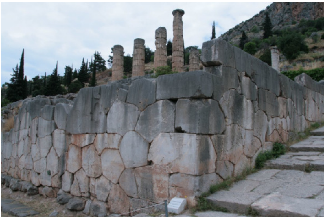
Рис. 13. Дельфы, Греция, полигональная стена [61]