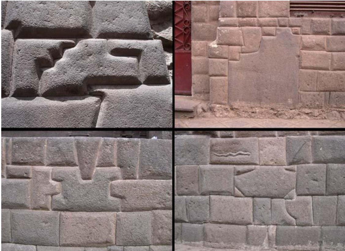
Рис. 43. Полигональные вставки из прямоугольных блоков

Андрей Скляр, «Древние боги – кто они» [119]. Места выемок под заготовкой не имеют никаких признаков примитивных технологий, поверхность гранита здесь практически отшлифована. Вряд ли это делали специально. Скорее всего, шлифовка – побочный результат работы инструмента, что дает дополнительный аргумент именно в пользу машинного оборудования с большой скоростью вращения инструмента. Если и вести речь о каком-то вращающемся инструменте, то он в сечении должен иметь форму мяча для регби. Хотя больше всего это напоминает гигантскую ложку, которой мастера вычерпывали твердый гранит из скального массива как мягкий пластилин ».