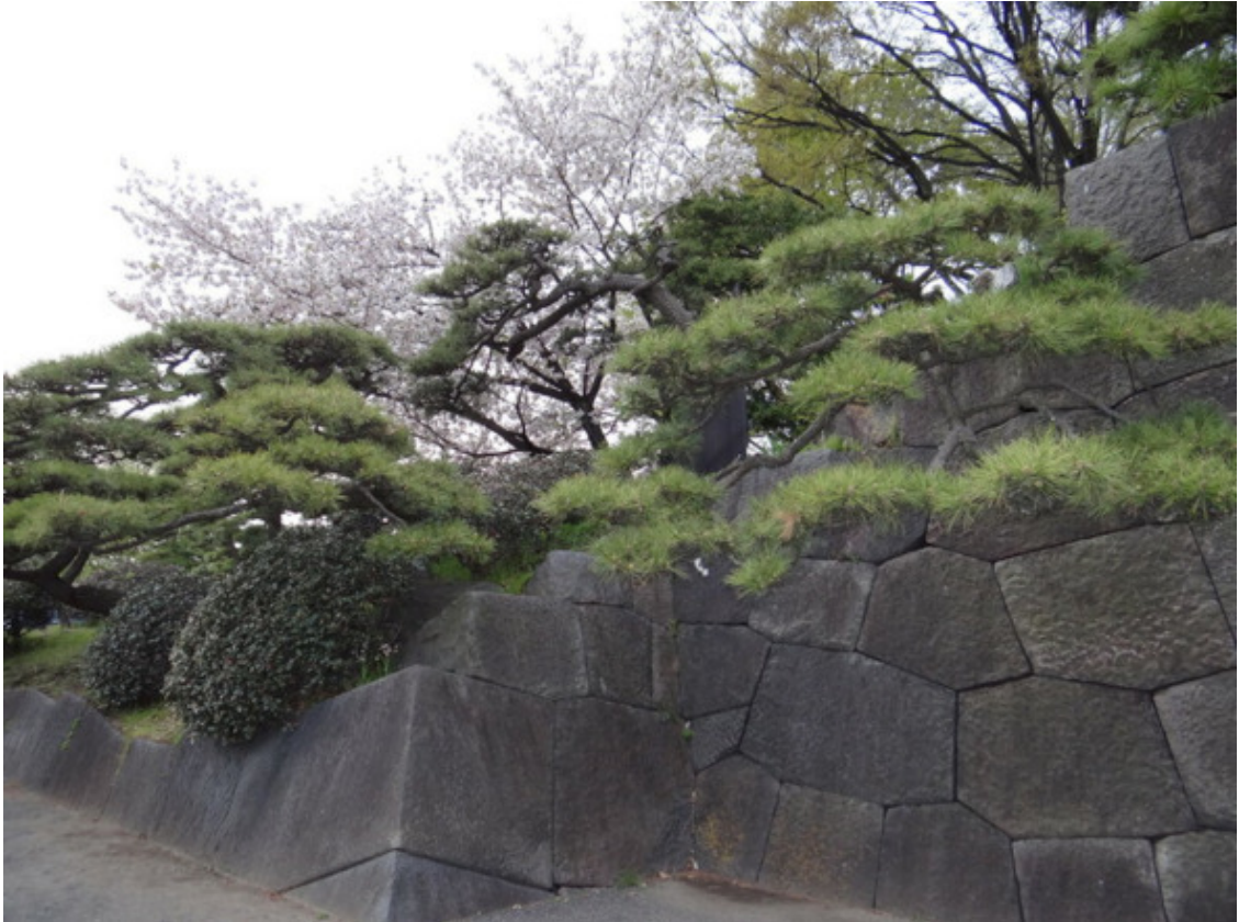
Рис. 31. Полигональная кладка в Японии [69]

Замок на рис. 33 установлен возле реки, берега которой укреплены блоками с примитивной полигональной кладкой.