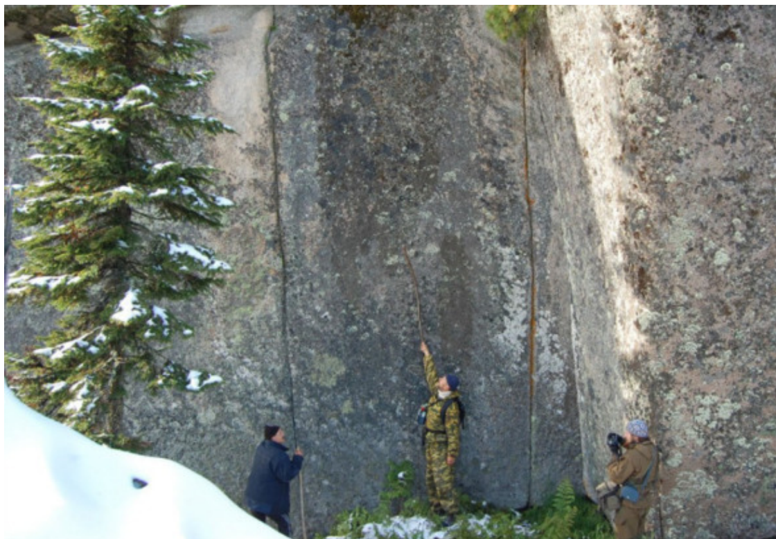
Рис. 27. Горная Шория [65]

Еще один пример стыковки огромнейших каменных блоков в Горной Шории – на рис. 27. По мнению Георгия Сидорова [65], это мегалитическое строение может являться руинами древней электростанции или энергоцентра, которая переводила сейсмическую энергию в какие-то другие виды энергии.