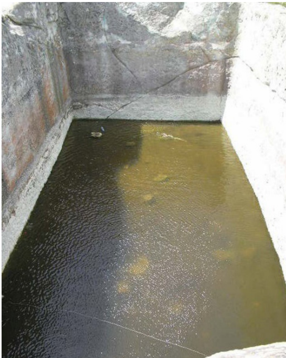
Рис. 25. На Кольском полуострове находится этот бассейн, вырезанный прямо в скале [65]

Ученые ломают голову: для чего нужен такой каменный бассейн на Кольском полуострове? Для купания или для добычи полезных ископаемых? А кто мог там купаться десятки тысяч лет назад?