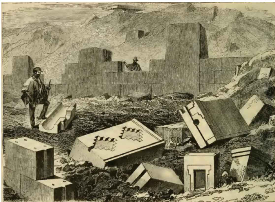
Рис. 8. Из книги Эфраима Скуайера, 1877 год, Тиуанако [79]

То, что осталось после взрывов, можно увидеть в книге Эфраима Скуайера, вышедшей в 1877 году [79]. Один рисунок из той книги – рис. 8.