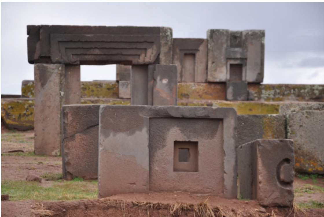
Рис. 12. Каменные блоки в Тиуанако [60]