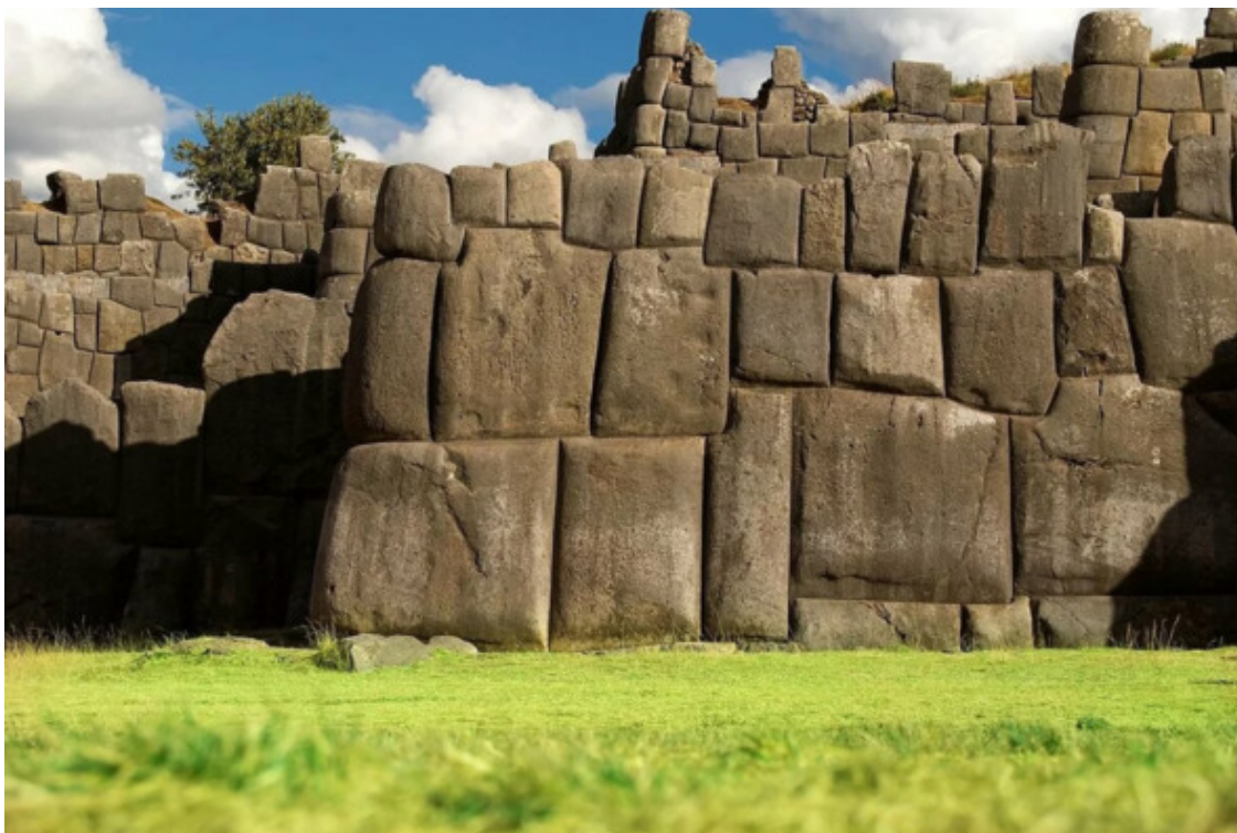
Рис. 6. Саксайуаман [55]