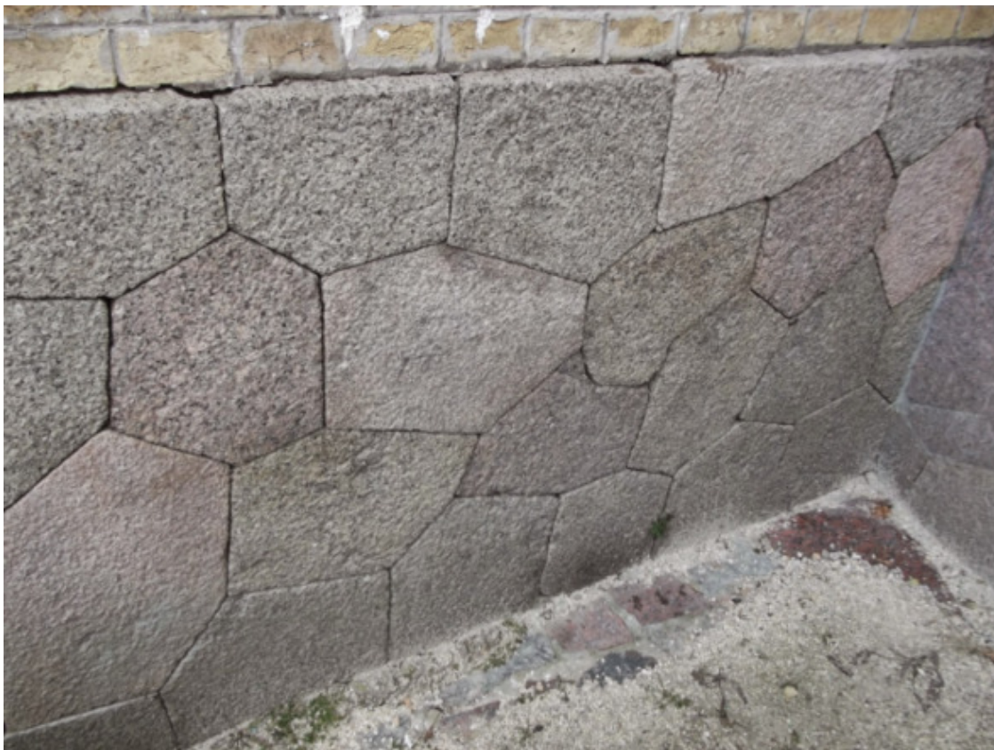
Рис. 30. Стена Киевской крепости [74]

Киевская крепость с полигональной кладкой (рис. 30) почти что в точности повторяет аналогичное строение в Кронштадте и Калининграде.