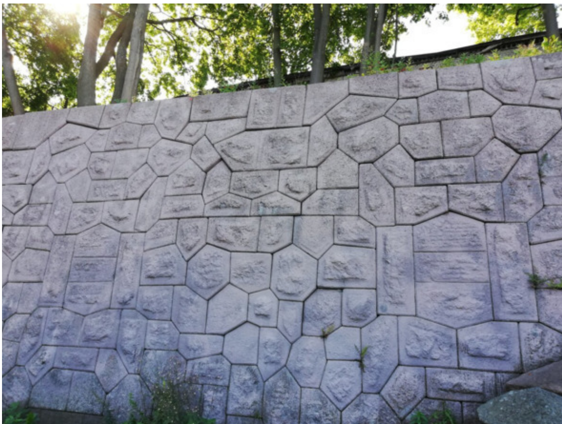
Рис. 17. Полигональная кладка в Кронштадте [73]