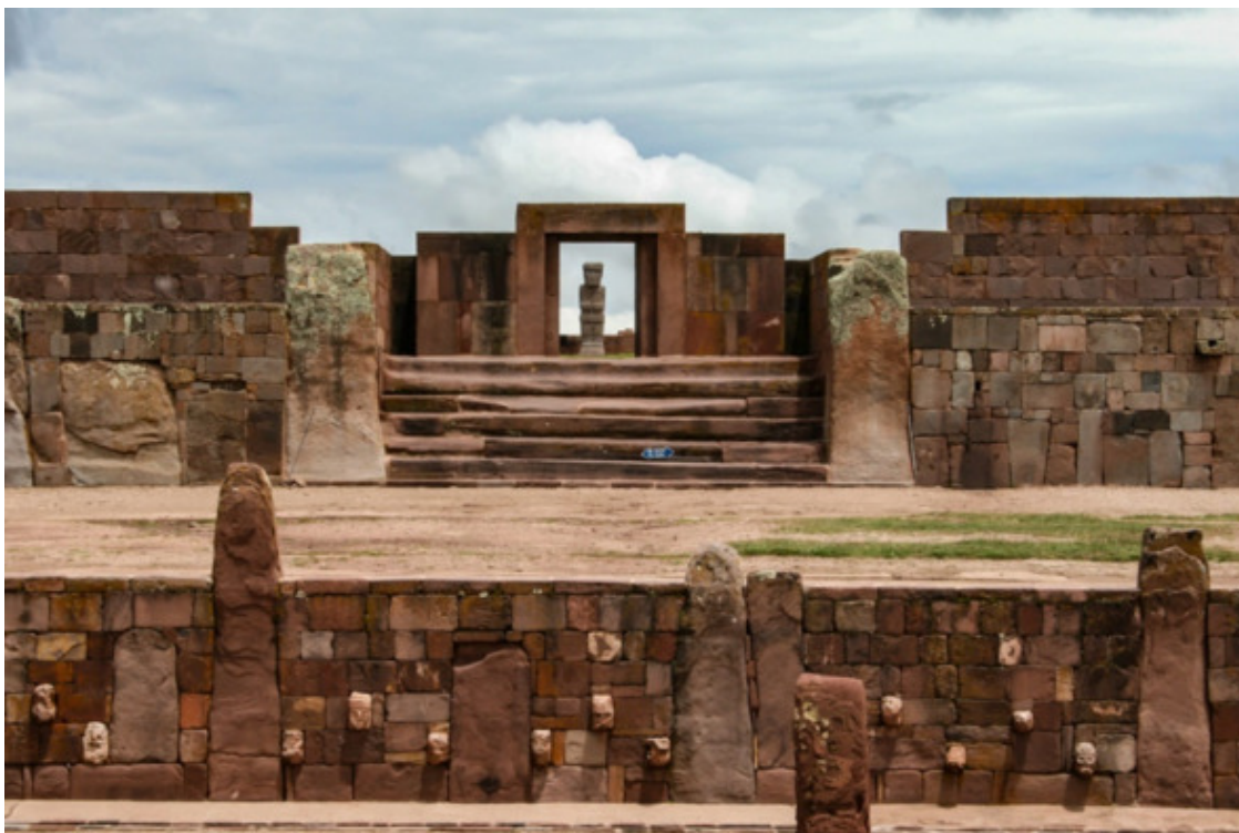
Рис. 9. Тиуанако, Храм Каменных Голов [58]

Законченных полигональных кладок сейчас в Тиуанако, практически нет. Показанный на рис. 9 Храм Каменных Голов является новоделом.