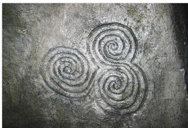
Рис. 45. Трискелион [41]

Александр Махов в своих работах [41] рассмотрел схему трех спиралей, которую назвал трискелионом. Рассматривая конструкцию Ньюгрейнджа, Александр Махов отметил, что смещение камеры внутри кургана и относительно его оси приводит к изменению фазы излучаемого сигнала. Смещение камеры внутри кургана и относительно его оси приводит к изменению фазы излучаемого сигнала. Далее А. Махов снова вернулся к изображению в плане 3-х-лепестковой камеры в кургане. По сути, это три связанных дольмена, расположенных по трем осям. Каждый из этих дольменов переизлучает свой сигнал. Форма же сигналов, в виде подсказки, дошла к нам со времён «Богов», это знаменитый трискелион, три спирали одной направленности вращения, но с отличием по фазе. Но, так как внутри коридорного волновода присутствует только один, сложный сигнал, суммированный от трех дольменов, то его можно интерпретировать как сигнал от одного источника, но модулированный по фазе. Другими словами, на выходе волновода каждого кургана с трехлепестковой камерой, имеем сигнал излучения с фазовой модуляцией (ФМ).