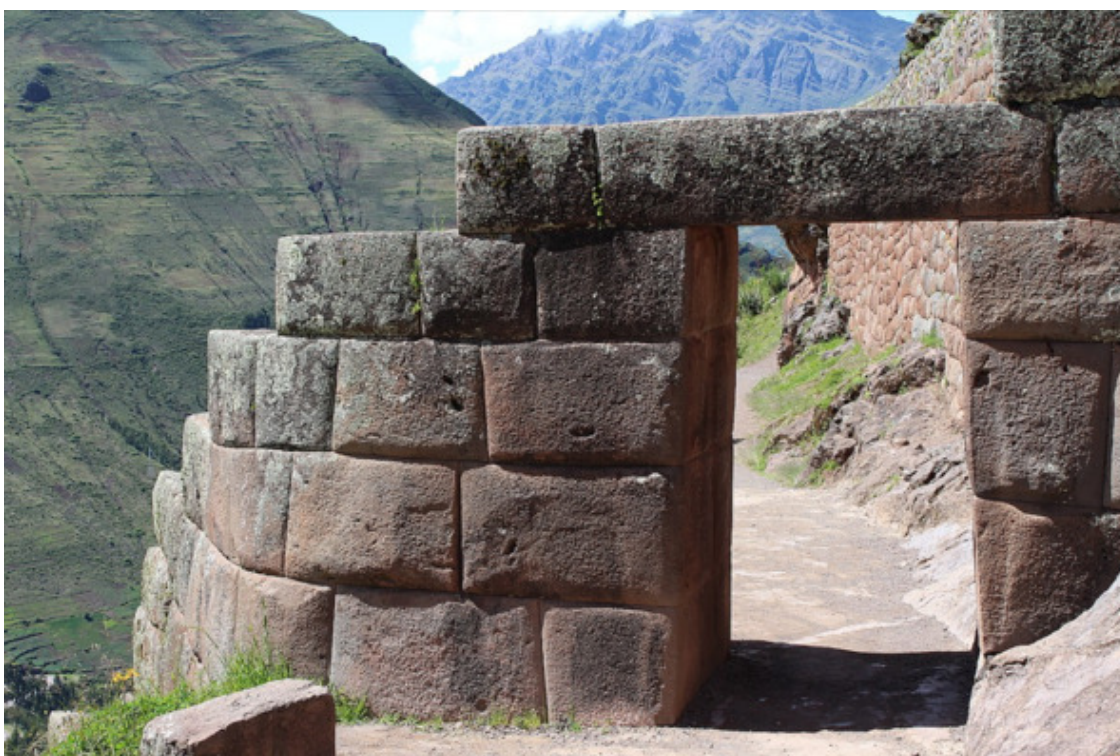
Рис. 15. Мачу-Пикчу [71]