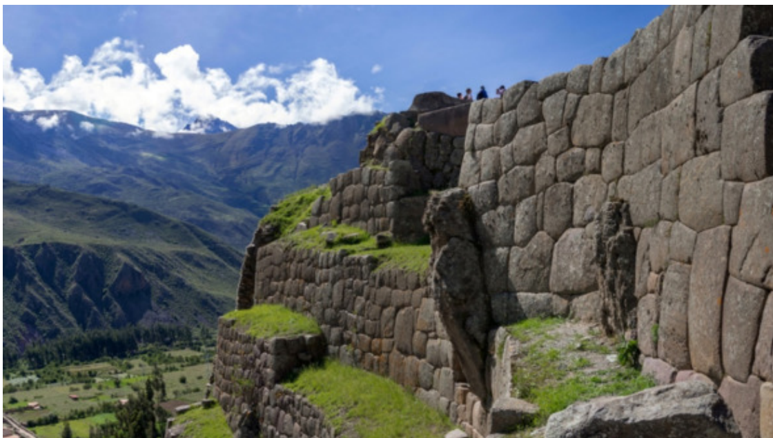
Рис. 2. Ольянтайтамбо [51]