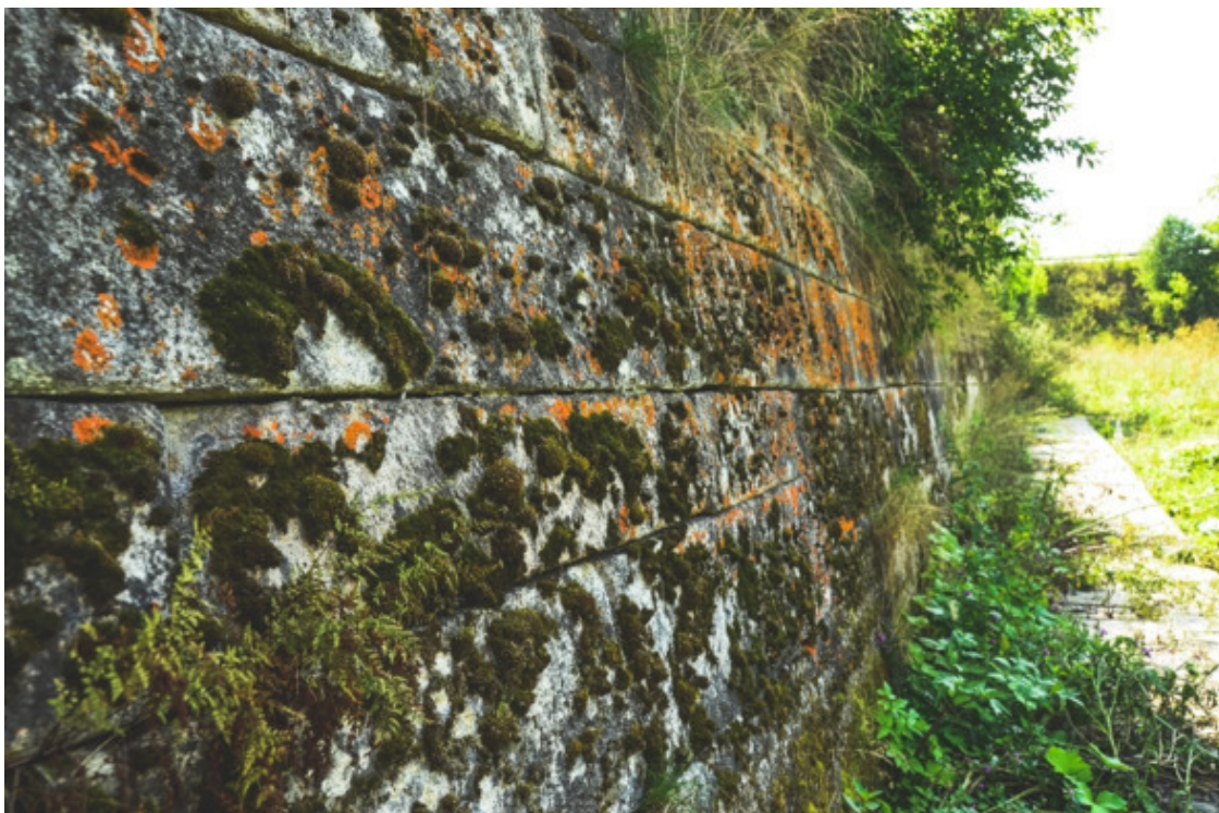
Рис. 28. Чусовская полигональная кладка на Урале [66]