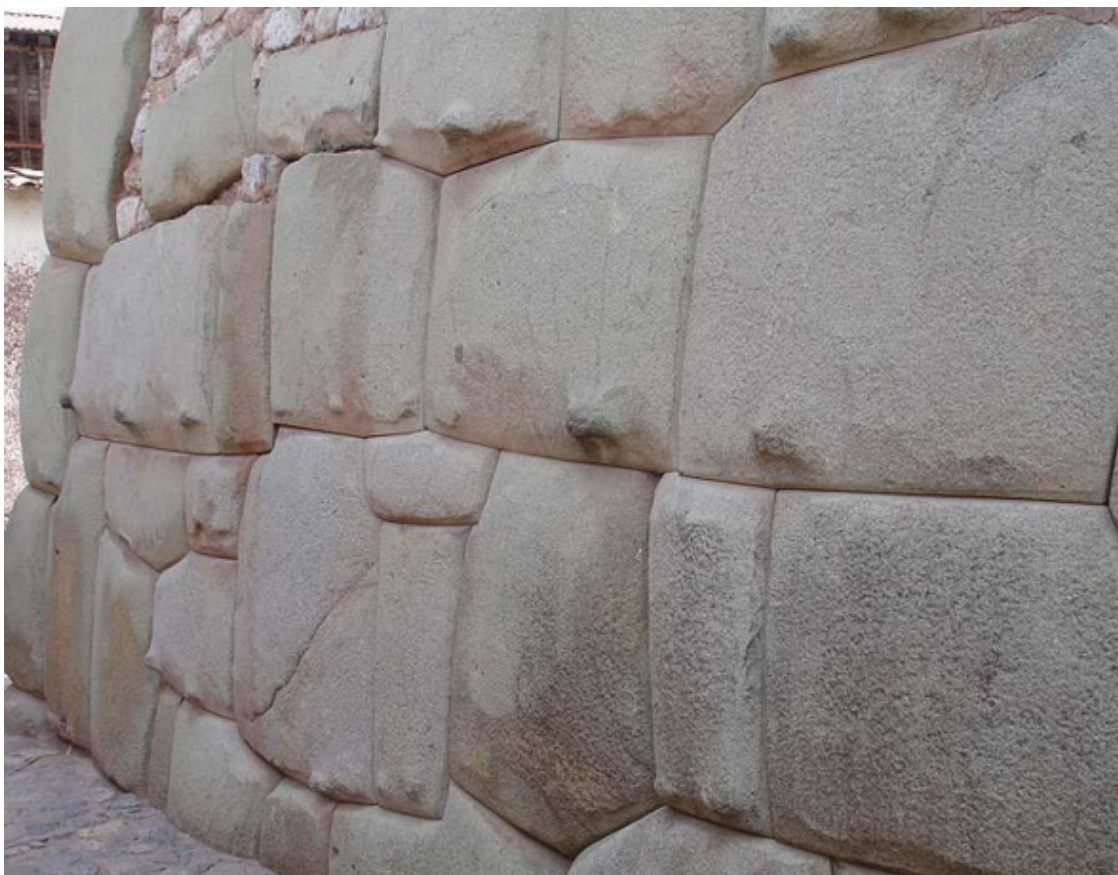
Рис. 42. Выступы на блоках полигональной кладки [155]

Во-вторых, нередко в кладке из прямоугольных блоков встречаются своеобразные «вставки» – участки, которыми древние строители как будто специально демонстрировали свое превосходство над современными мастерами. Сочленение блоков на таких участках носит полигональный характер и требует очень тщательной и высоко квалифицированной работы с камнем.