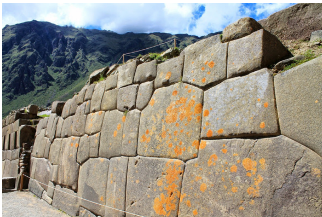
Рис. 1. Ольянтайтамбо [50]

Внизу расположен Храм Воды и церемониальный фонтан, который функционирует и по сей день. Интересна сеть из желобов вдоль тротуаров, по которым до сих пор, со времен инков, бежит вода. Где это необходимо, вода пускается под тротуар, а потом разветвляясь в нужных местах, дальше растекается по улицам. А главное – вода как в Ольянтайтамбо, так и в Мачу-Пикчу и других подобных городах течет естественным путем, начинаясь с горных ручьев и речушек.