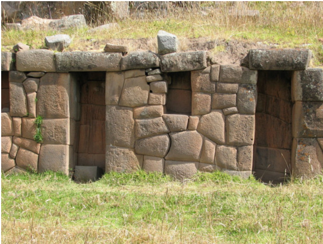
Рис. 34. Интиуатан, Перу [75]