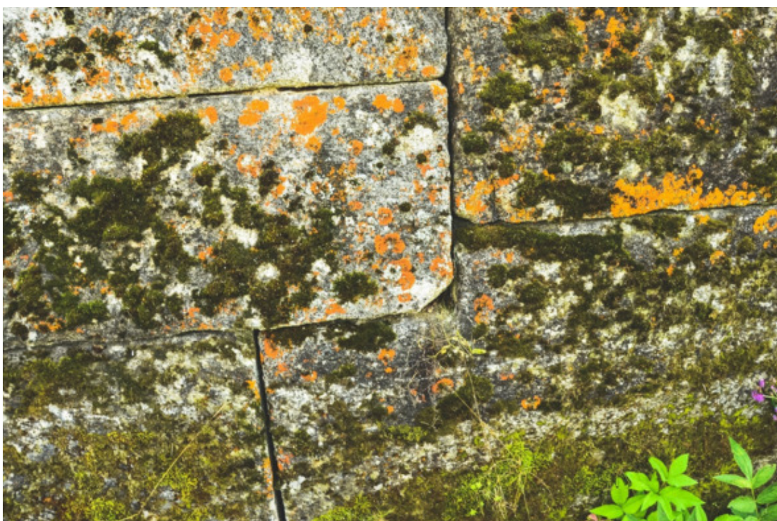
Рис. 29. Чусовская полигональная кладка на Урале [66]