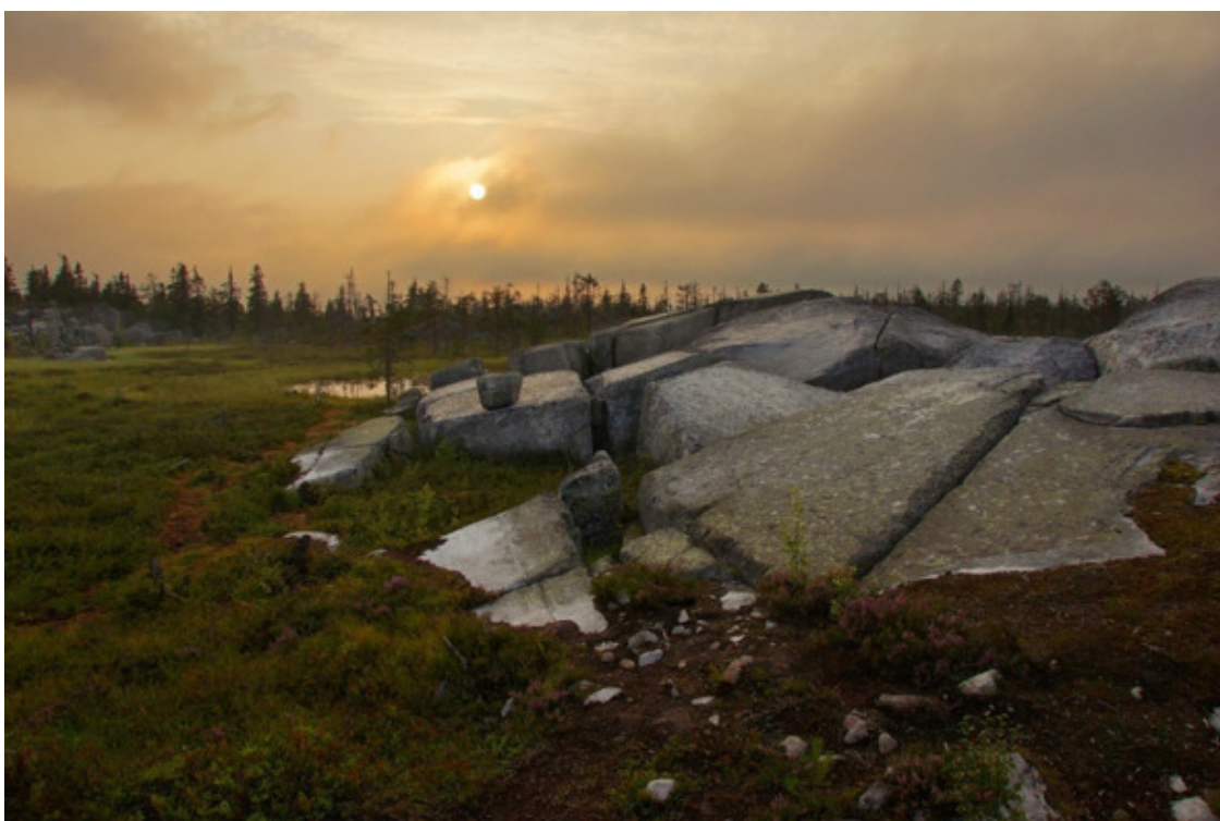
Рис. 22. Воттоваара. Карелия [65]

Теперь посмотрите на огромнейшие каменные и гранитные глыбы, точно вырезанные и пригнанные друг к другу в Баксанском ущелье в Кабардино-Балкарии – рис. 23. Здесь не принято говорить о полигональной кладке. Однако, давайте вспомним, официальное содержание термина «полигональная кладка». Полигональная кладка – это тип кладки из притёсанных друг к другу камней или блоков с разными формами, состыкованных друг с другом под про-