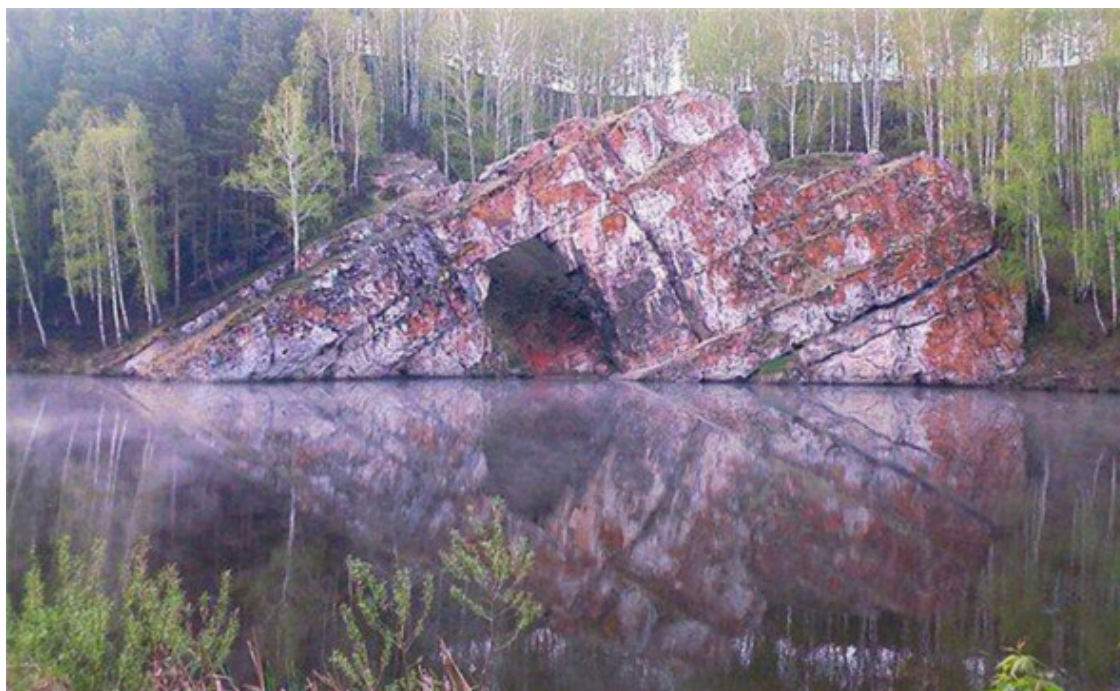
Рис. 20. Воттоваара, Карелия [65]

Место просто полно странными артефактами, после которых начинаешь задумываться о древних высокоразвитых технологиях по камнеобработке, давайте лучше посмотрим на фото на рис. 20 – рис. 22.