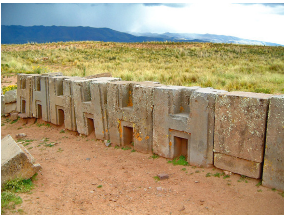
Рис. 11. Блоки Тиуанако [60]