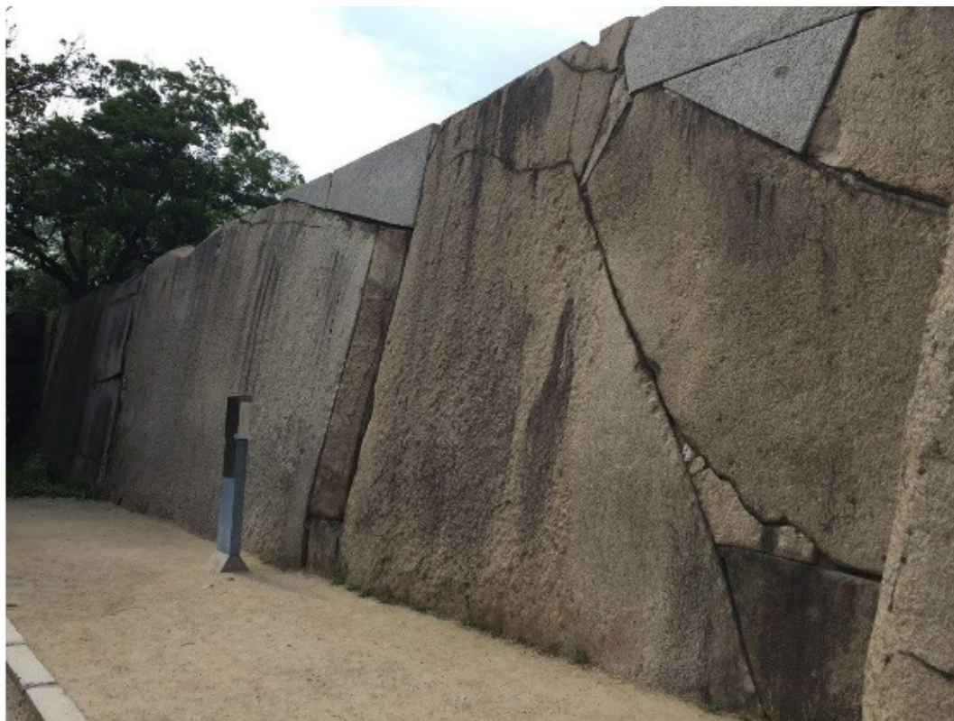
Рис. 32. Мегалиты Японии. Замок Осака [69]