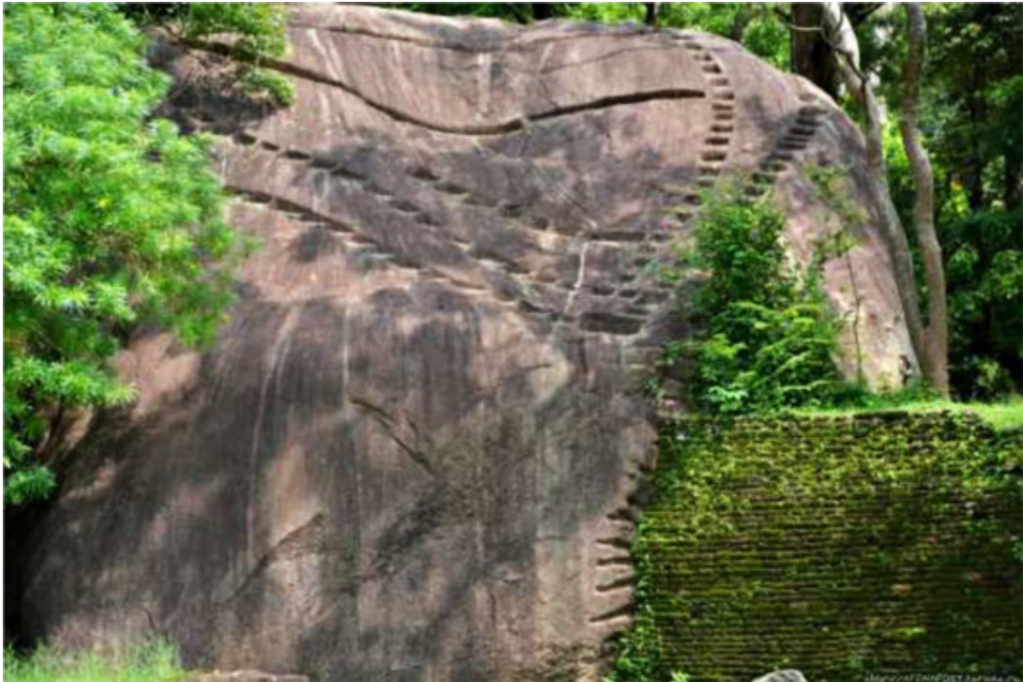
Рис. 38. Сигирия, Шри Ланка [139]

В Сигирии, в Шри Ланке, можно наблюдать многочисленные результаты размягчения камней при строительстве.