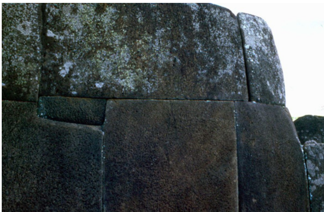
Рис. 36. Платформа Аху Винапу. Остров Пасхи

Остров имеет форму треугольника, по углам которого возвышаются вулканы: Рано-Арои (539 м – высшая точка острова), Катики (377 м), Рано-Као (324 м), между ними – холмистая равнина, сложенная вулканическими туфами и базальтами. Ко времени открытия острова голландским мореплавателем Я. Роггевеном (5 апреля 1722, в день Пасхи, отсюда название острова) население, находившееся на стадии разложения первобытнообщинного строя, достигало 3—4 тыс. чел. В 1862 перуанские работорговцы истребили большую часть коренных жителей; была разрушена их самобытная культура. В 1888 остров Пасхи был присоединён к Чили. Это место находится на нижних склонах Теревака – самого большого и самого молодого из трех потухших вулканов, которые и образуют Рапа-Нуи (более известного как остров Пасхи).