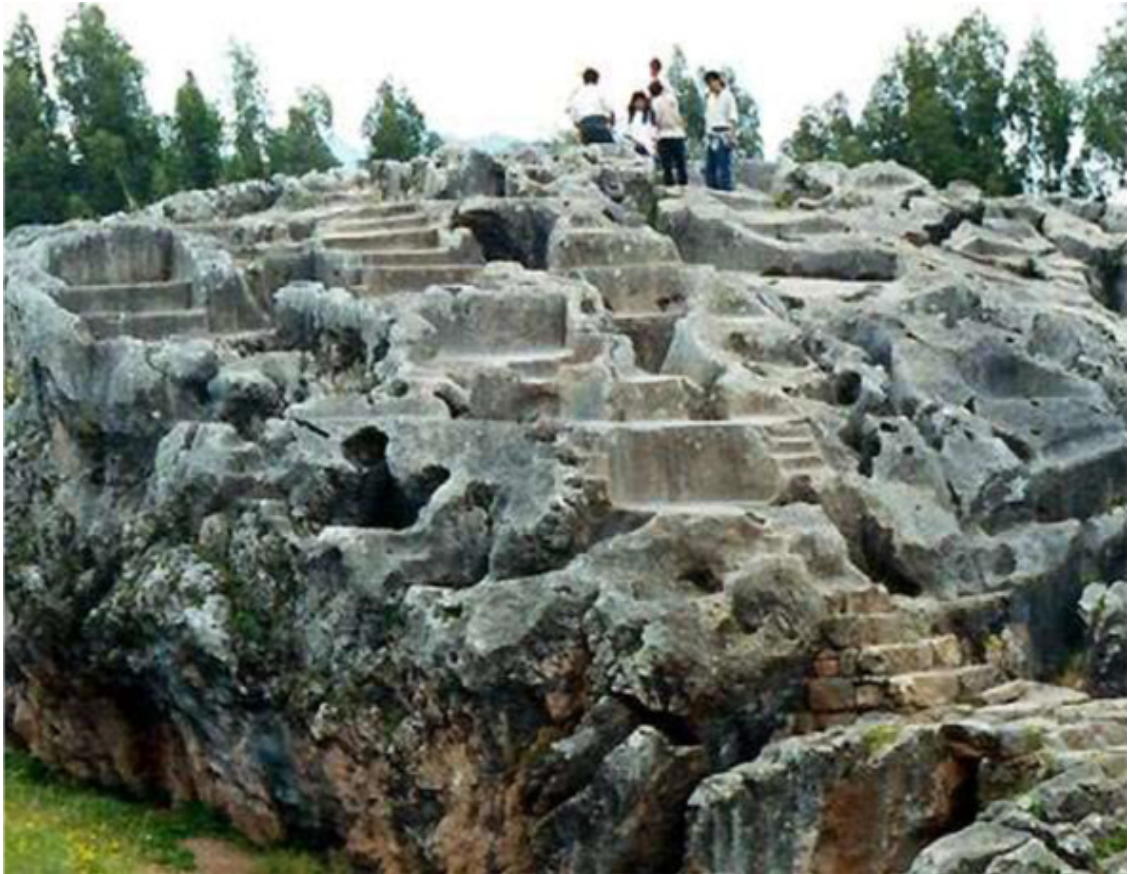
Рис. 40. Сигирия, Шри Ланка [139]

Существует одно предположение, как размягчали камень, о нём, кстати говорят многие древние легенды, что камень можно сделать пластичным, воздействуя на него особыми, специально подобранными звуковыми волнами.