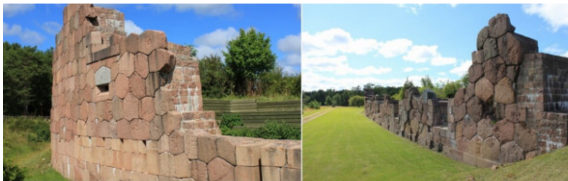
Рис. 37. Остатки крепости Бомарсунд в Финляндии [77]

Остатки крепости Бомарсунд из Финляндия показаны на рис. 37. Здесь наблюдается грубая обработка камня. Хотя это и гранит, имеющий большую твердость и который не так легко обрабатывать, для улучшения фортификационных показателей крепости строители применили именно его.