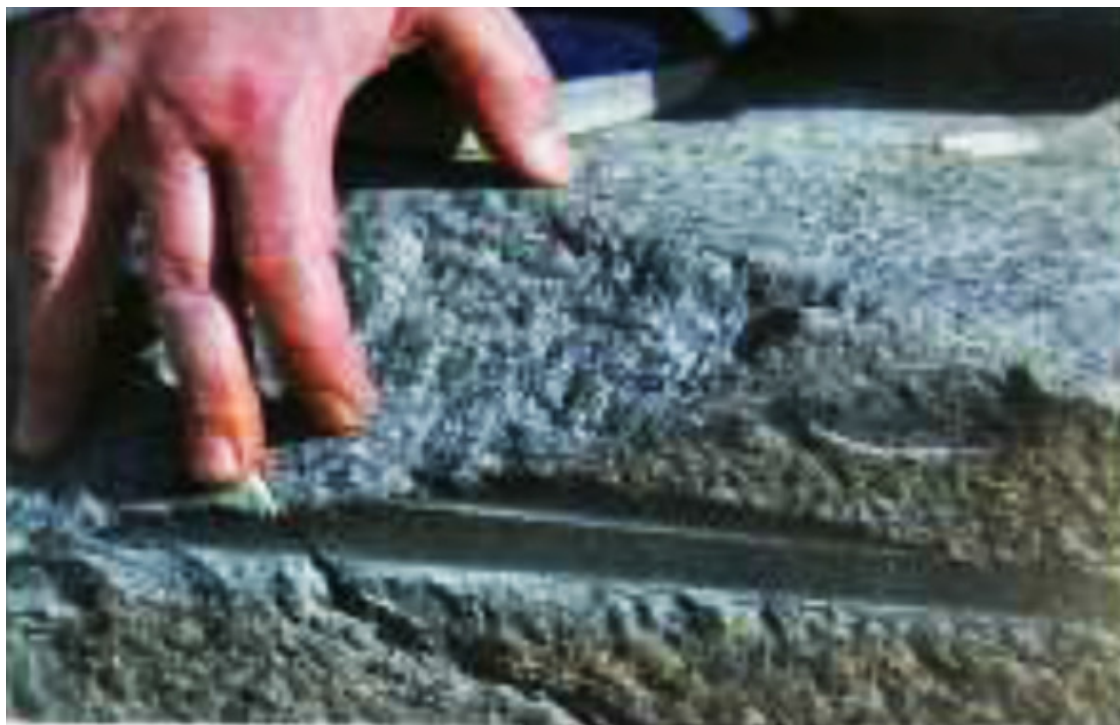
Рис. 44. Из книги Андрея Складорова [118]

Можно отметить сразу несколько важных моментов.