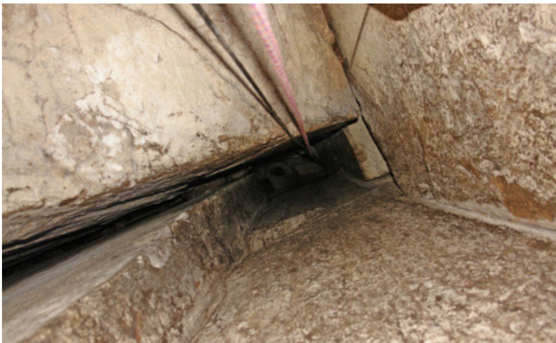
Рис. 24. Пещера под названием «Фляга» в Баксанском ущелье [65]

Еще один пример обработки и сочетания огромнейших каменных блоков на Кольском полуострове показан на рис. 25.