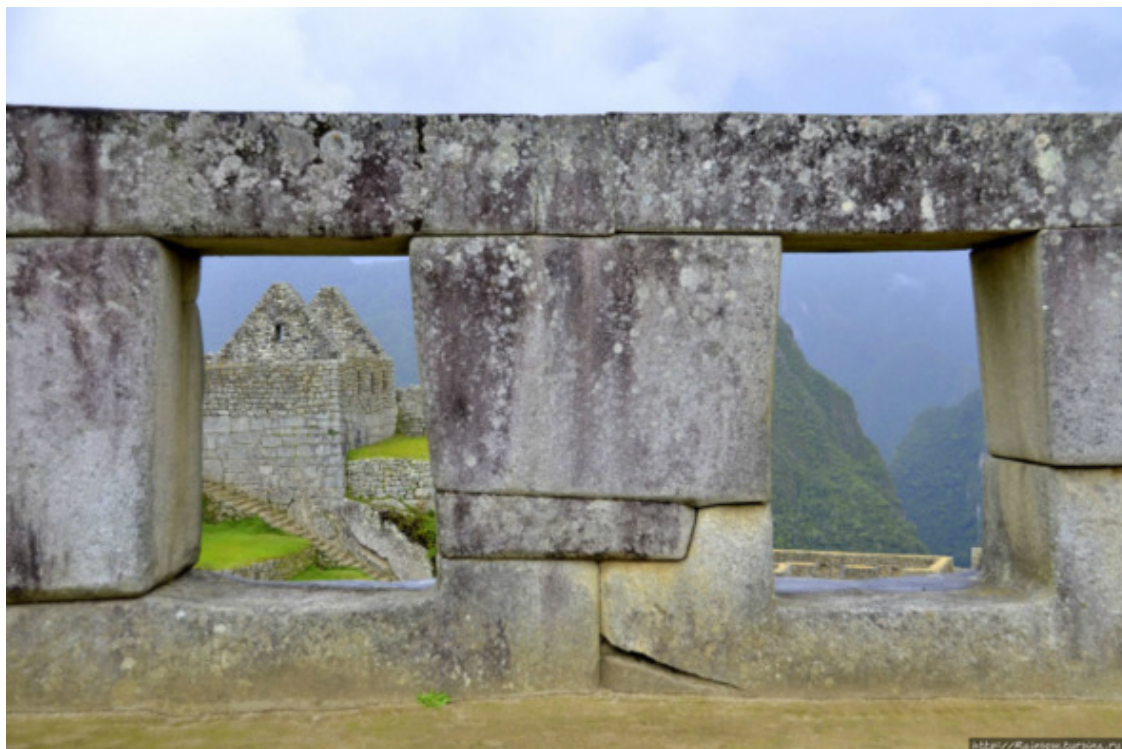
Рис. 16. Мачу-Пикчу [72]