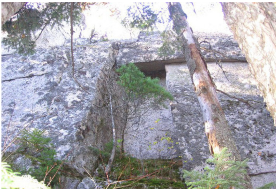
Рис. 23. Кабардино-Балкария, пещера в Баксанском ущелье [65]

извольными углами. Так все это справедливо для блоков в Баксанском ущелье. Посмотрите на фото на рис. 23.