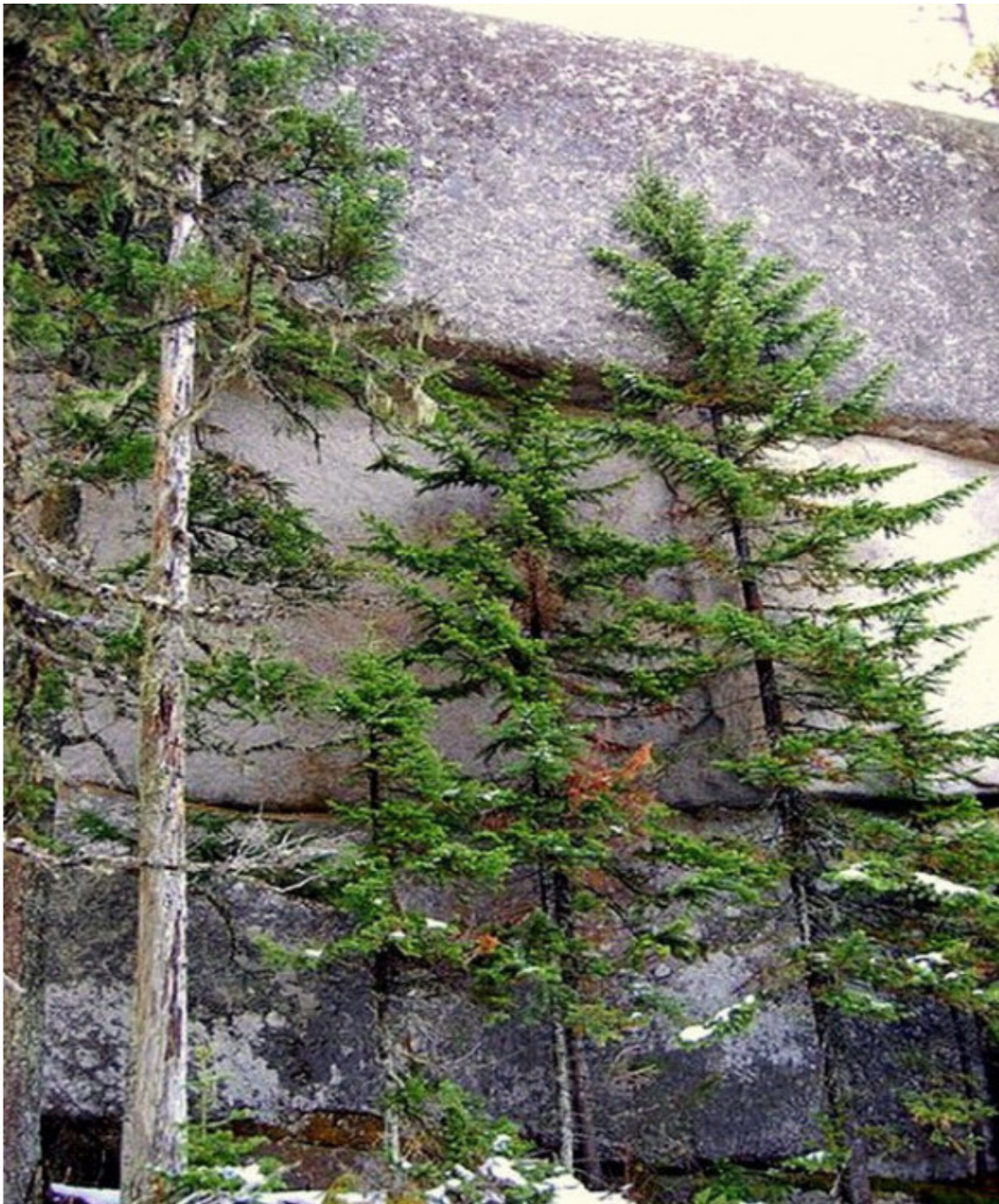
Рис. 26. Горная Шория [65]. Стена сложена полигональной кладкой из разноцветных блоков