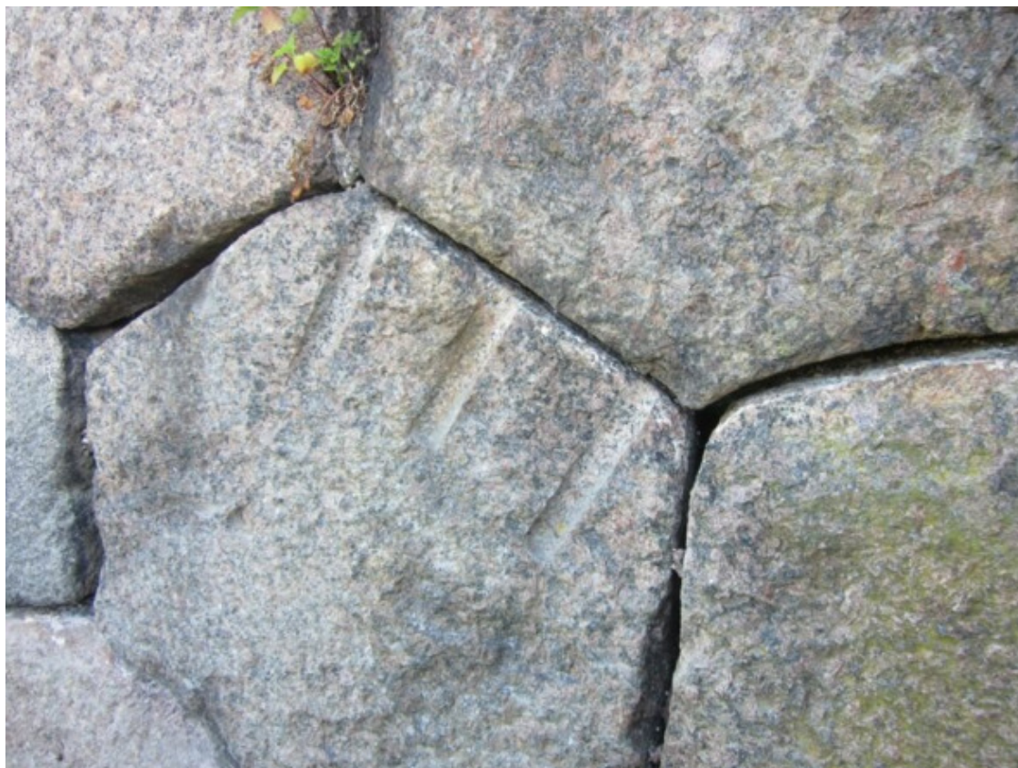
Рис. 19. Кронштадт, полигональная кладка. На камнях видны следы механической обработки [68]

Автор работы [175] считает, что объем работ в Кронштадте небольшой – 1,5 километра стены. При наличии нескольких тысяч, а то и десятков тысяч, строителей под руководством опытных камнетесов, это работа, максимум на несколько месяцев.