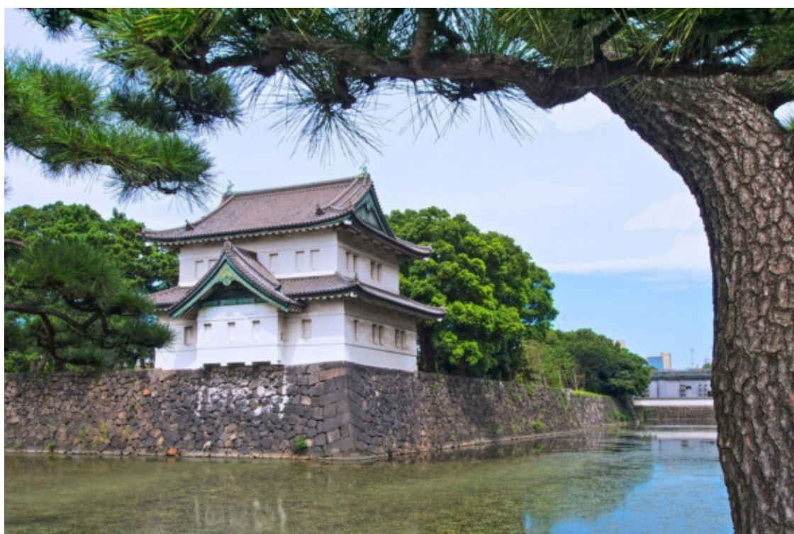
Рис. 33. Япония [69]