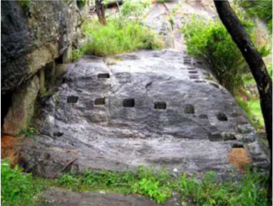
Рис. 41. Сигирия, Шри Ланка [139]

Следующее фото просто уникально – рис. 41. На Сигирии есть самый настоящий сейд, точно такой же, какие встречаются на Кольском полуострове, в Карелии и других местах. Только этот сейд просто гигантский. Монолит весом минимум 2500 тонн, поставлен на подпорки из небольших камней. Слева на изображении, мы как раз видим эти камни, на которые опирается огромный валун. Чтобы подпорки не ушли из-под камня сюда вывалили «машину каменного раствора» и подпёрли им несущие опоры. Очень хорошо видно, как вязкая каменная масса обволакивала камни под монолитом. Эта фотография снимает все вопросы и однозначно говорит, что камень был жидким .