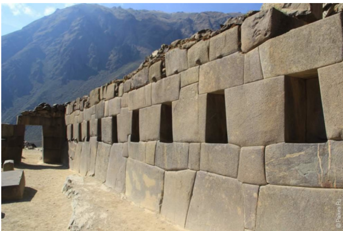
Рис. 3. Ольянтайтамбо. Храм 10 ниш [52]