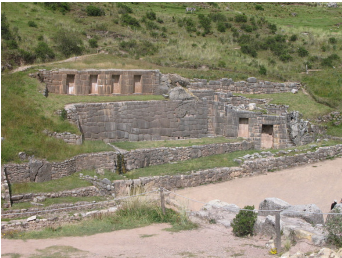
Рис. 35. Тамбомачай, Перу