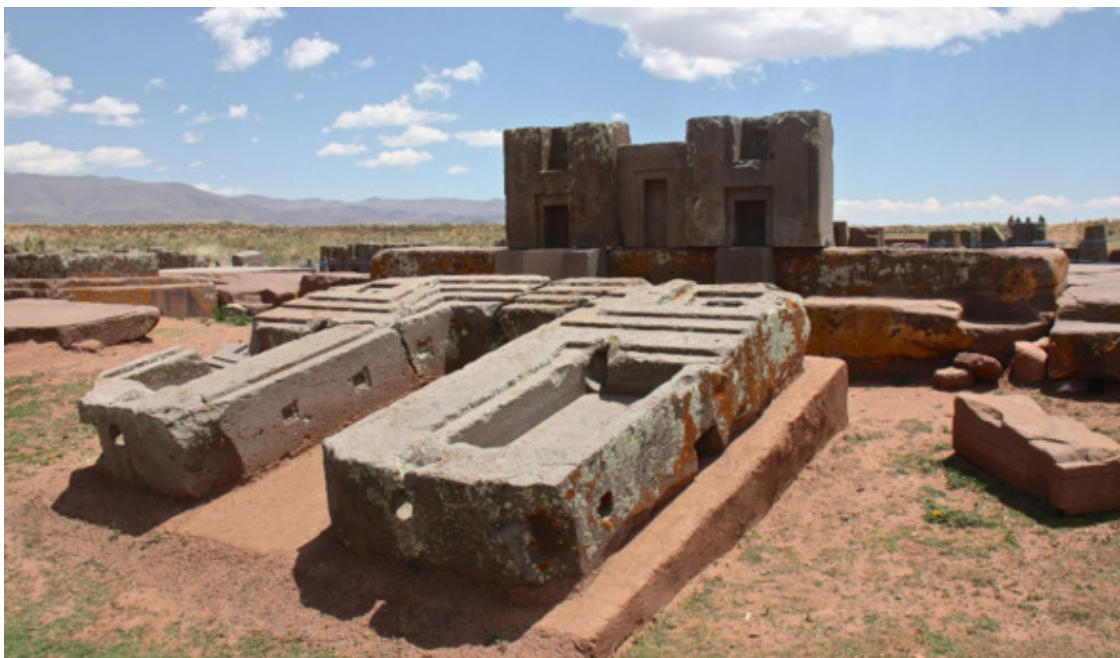
Рис. 10. Пума-Пунку, Тиуанако [59]