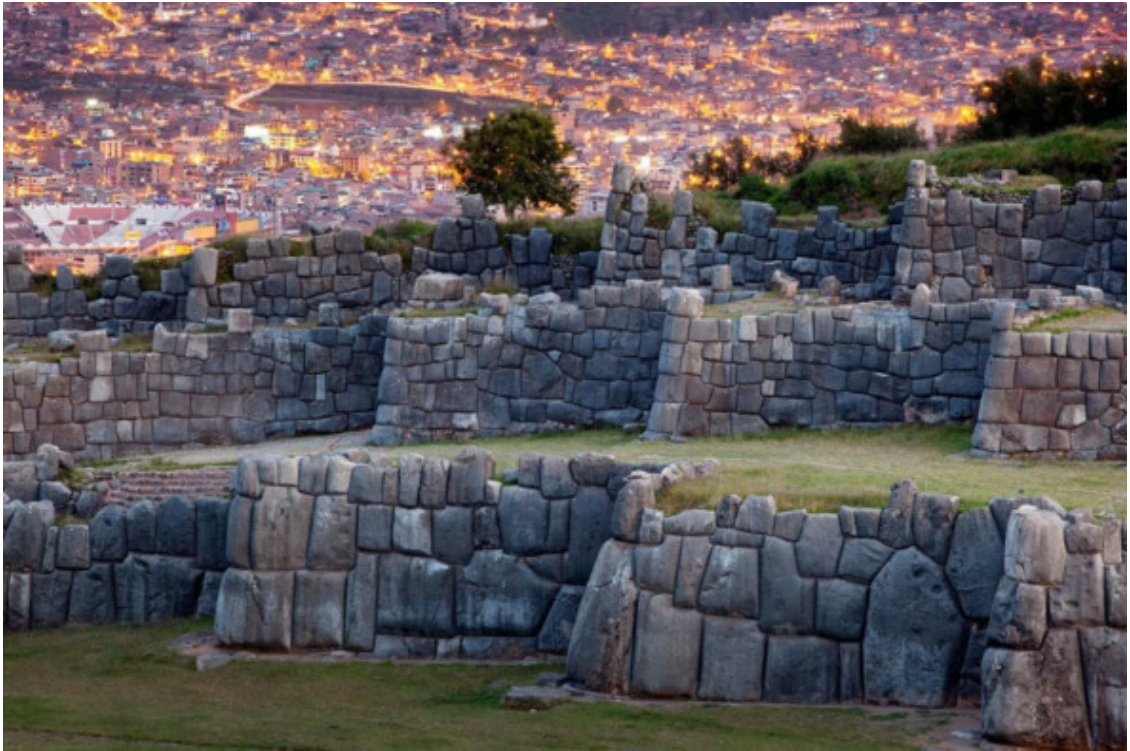
Рис. 4. Саксайуаман [54]