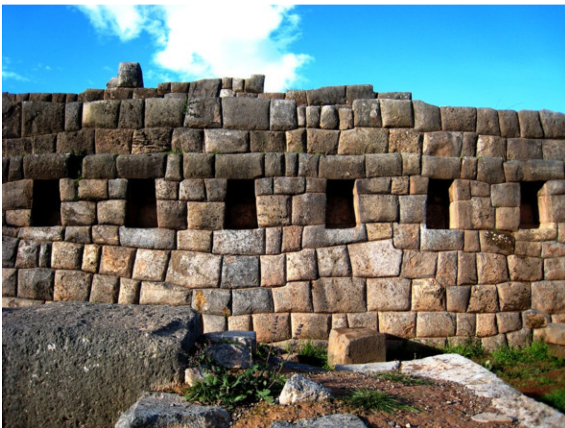
Рис. 7. Саксайуаман [55]