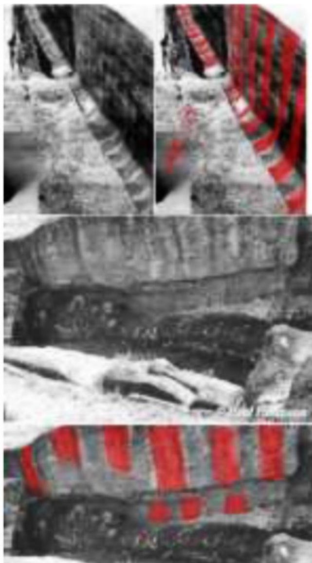
Рис. 47. Сходство технологий на острове Пасхи и в Египте [130]

Предлагается вариант, когда соски являются побочным явлением. Вообще же выбор невелик, соски могут быть побочным явлением, а могут быть и специально созданными элементами (тут же – элементами побочными, но оставившимися как специальные). Один и тот же инструмент должен оставлять следы, которые будут похожи. Размер босса или соска предполагает и соответствующий размер инструмента. Храм 10 ниш, Ольянтайтамбо. Некоторые ниши с сосками в глубине. Я могу насчитать четыре таких ниши. Все соски находятся в нижней части тыльной стороны ниш. По центру ниши. На их расположение не оказывает влияние конфигурация блока, образующего тыльную сторону. Вряд ли ниши делались специально так, чтоб соски на блоках, служащих тыльной стороной ниш, приходились точно по центру нижней части ниш. Это – первое. Второе. Конфигурация блоков тыльной части ниш. Это может быть важно. Сосок, расположенный со внутренней стороны угла, – штука интересная. Это всё вот к чему, – данные детали могут свидетельствовать о том, что соски создавались после установки блоков, выборочно в необходимых местах . Они были не вторичным следствием пластификации, а вполне самостоятельными функциональными деталями. То, что, в основном, боссы внизу, это я могу понять. А то, что, в глубине ниши есть боссы по центру, несколько не умоляет следующую обработку электродами. Та же технология, но проще было