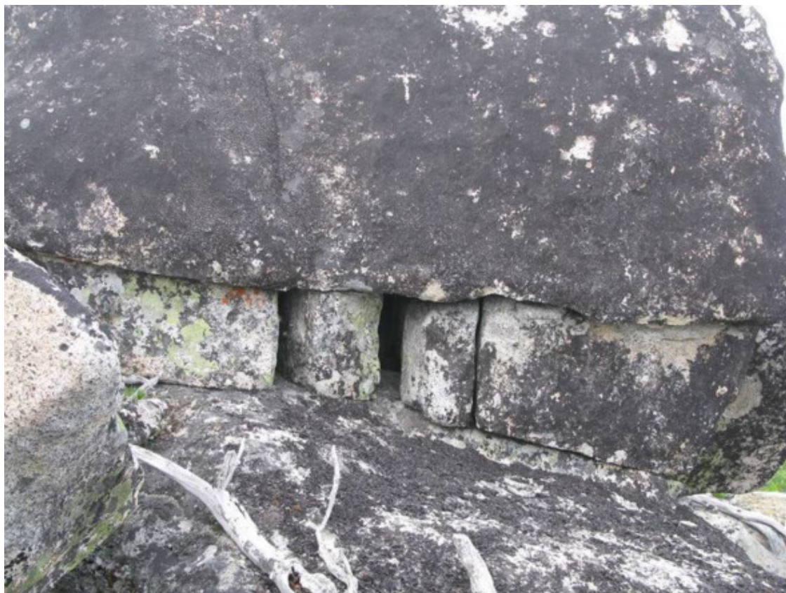
Рис. 46. Магадан [105]