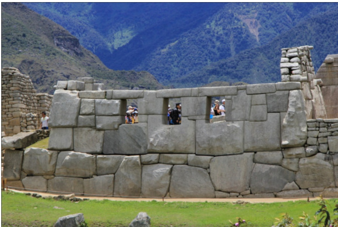
Рис. 14. Мачу-Пикчу. Храм трех окон [70]