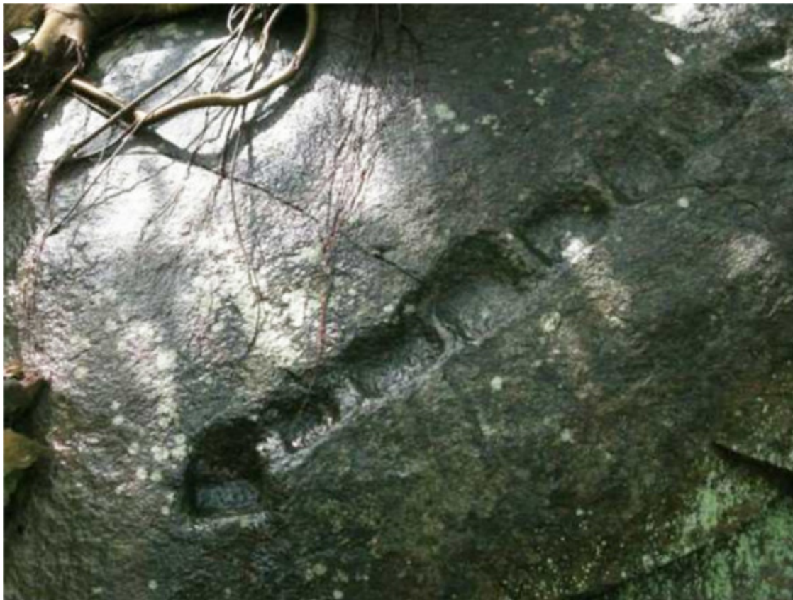
Рис. 39. Сигирия, Шри Ланка [139]

Современная наука уже теоретически обосновала возможность придания твёрдому кристаллическому телу пластичности, с последующим возвратом к твёрдости. И сегодня это признанный факт. Другое дело, что реализовать на практике для полигональной кладки этот метод мы еще не можем, т.к. он связан с излучениями кристаллов, ваджры и других древних устройств, которые сейчас не работают. Но сейчас нам важен сам факт того, что размягчение камня возможно.