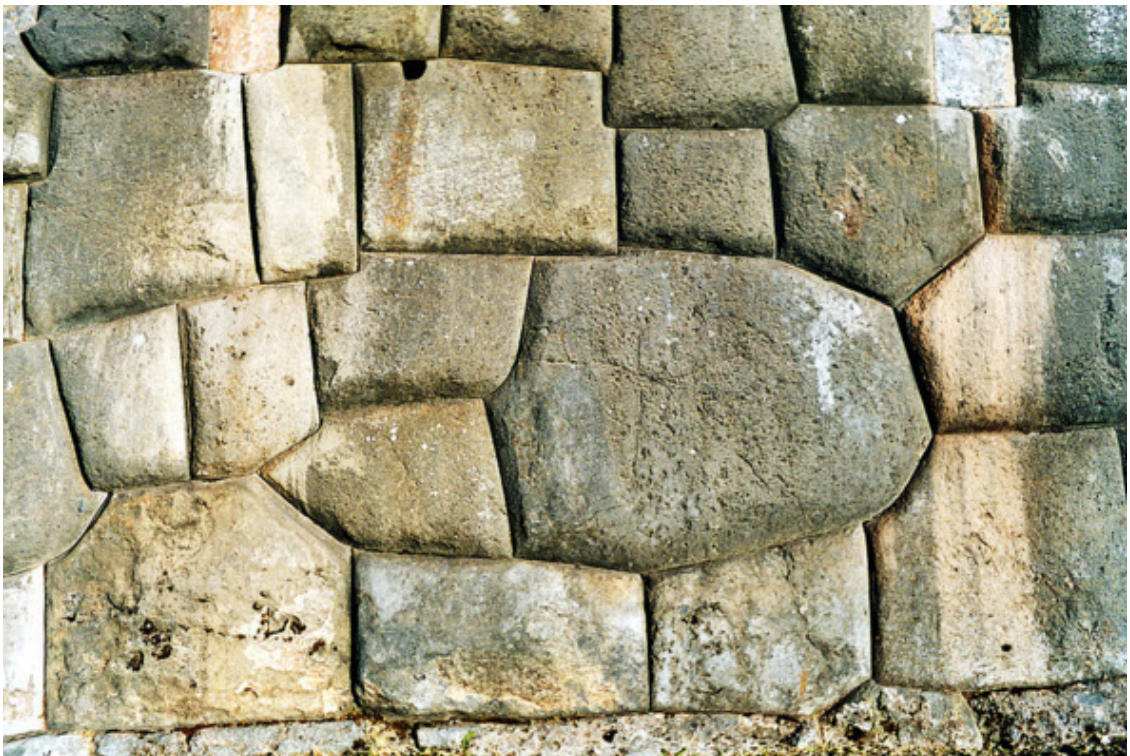
Рис. 5. Саксайуаман, Перу [54]