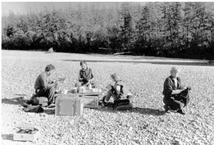
На речной косе реки Омолон

При плавании на моторках, мы тихонько браконьерствовали для поддержания штанов, поскольку выплыли из зоны досягаемости МИ-8 от базы в п. Зырянка и со жратвой было туго. Быт скрашивали местные охотники, время от времени посещавшие наши стоянки. С их обязательными вопросами, при традиционном чаепитии: «Откуда? Давно? Какая зарплата?».