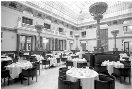
Зал «Славянского базара»

Расположившись за столиком, я первым делом потребовал что-нибудь диетическое. Но коллеги резонно рассудили, что надо отпраздновать жизненный финиш и налили водки. Дальнейшее помню смутно. Протрезвел я уже в Батагае, через неделю, перед заброской в тайгу. Как ни странно без всяких болей в животе. Видимо водка и знаменитые пирожки-расстегаи в Славянском базаре были правильные.