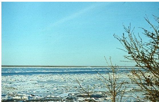
Ледоход на реке Колыма

Весна на северных широтах еще не набрала силу. Вокруг Зырянки лежал снег, с гор порывами налетал по-зимнему холодный ветер, но солнце грело. Речной лед четыре дня назад стал серым, ноздреватым. Позавчера появились трещины, полыньи. А сегодня ледяное поле пришло в движение и медленно двинулось вниз по Колыме, раскалываясь на отдельные куски.