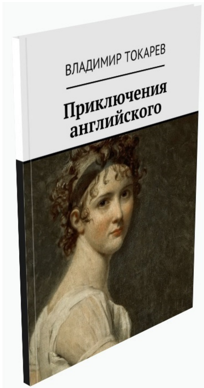
Рис. 2. Моя первая книга про английский.

Здесь же я собираюсь продолжить свою историю в режиме реалити-шоу.