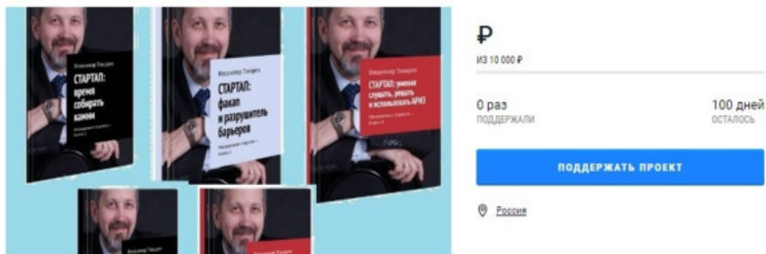
Рис. 1. Заставка проекта краудфандинга

Издание собрания сочинений по менеджменту в 21 томе, позволяющие преодолеть неблагоприятные экономические последствия кризиса, который принес коронавирус. Уже издано 20 томов.