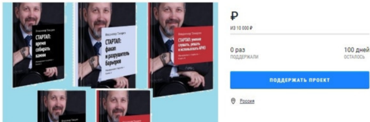
Рис. 1. Заставка проекта краудфандинга

Издание собрания сочинений по менеджменту в 21 томе, позволяющие преодолеть неблагоприятные экономические последствия кризиса, который принес коронавирус. Уже издано 20 томов.