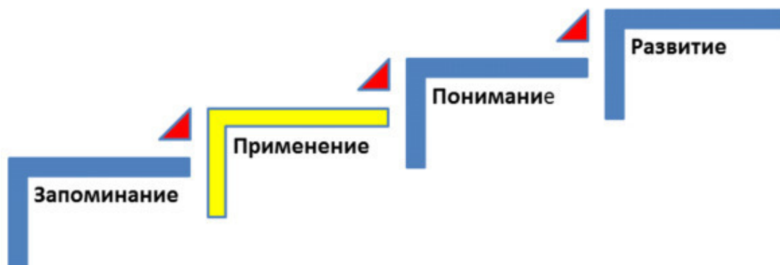
Рис. 4. Классический алгоритм познания нового.

Когда мы познаем новое, то сначала запоминаем информацию.