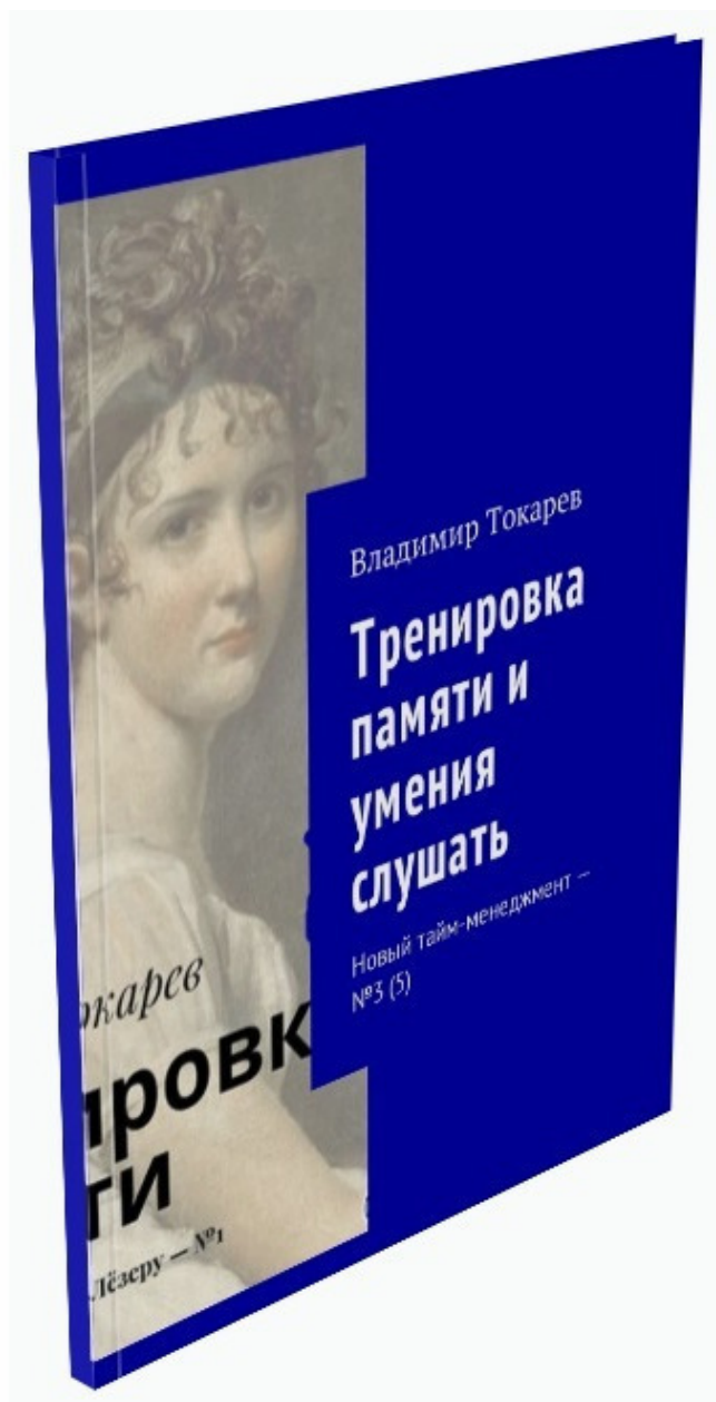
Рис. 6. Эта книга входит в серию книг по новому тайм-менеджменту.

А барьеров при преодолении этой неприступной крепости большое число.