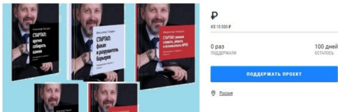
Рис. 1. Заставка проекта краудфандинга

Издание собрания сочинений по менеджменту в 21 томе, позволяющие преодолеть неблагоприятные экономические последствия кризиса, который принес коронавирус. Уже издано 20 томов.