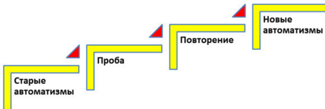
Рис. 5. Приобретение новых привычек.

А вот процесс применения нового знания развивается по другому алгоритму: сначала мы действуем как привыкли, например, произносим английские слова с русским акцентом, как это пока делаю и я.