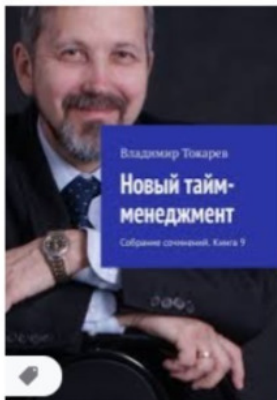
Владимир Токарев, Н... litres.ru · В наличии