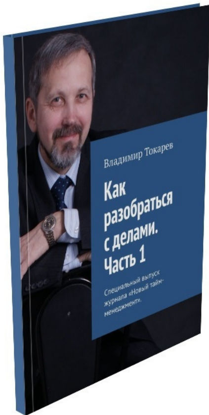
Рис. 7. Первая книга пятого издания нового тайм-менеджмента 1 .