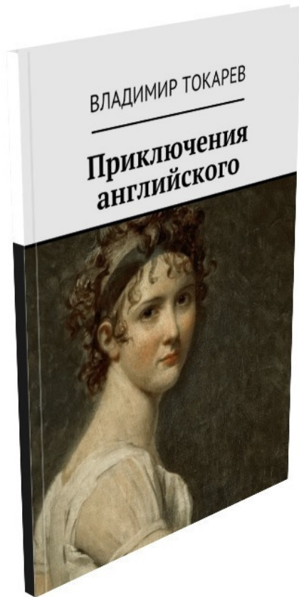
Рис. 4. Обложка книги первого вознаграждения для спонсоров проекта.

Эта книга описывает мой прошлый положительный опыт