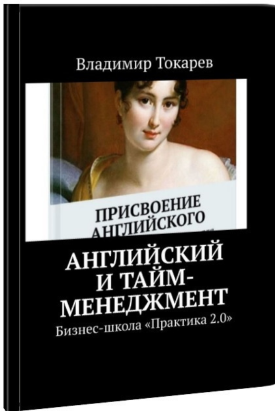
Рис. 2. Книга с программой новой специальности. Скачивается бесплатно

Мы приглашаем на новую программу всех, для кого