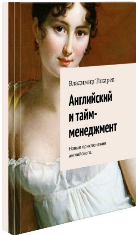
Рис. 5. Издание этой книги – цель проекта краудфандинга.

Эта книга описывает мой настоящий опыт в самостоятельном овладении английским языком. Это особенность книги. Бонусом к данному вознаграждению будет книга «При-