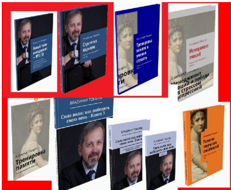
Рис. 6. Пятое издание «Нового тайм-менеджмента» вышло 8 книгах». Запланированная книга по менеджменту эмоций переросла «одну книгу в составе пятого издания» и превратилась в самостоятельную серию книг, описывающую управление 10 важными эмоциями.